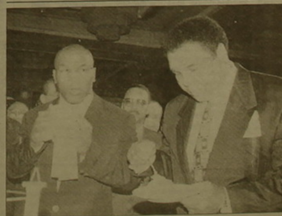
Բոնգամարի հանրահայտ առաջին Մայլ Թայսոնը (մախից) և Սոխանդ Միլն Լաս Վեգասում կազմակերպված ընդունելության ժամանակ:

Այստիսով, Կասալոնիայի ղխավոր քիմը՝ «Բարսելոնը», կիսով ղափ հողանդական է ղառնում: Մինչ այդ էլ նրա կազմում «կակայների երկրի» մի քանի Ֆուսթիսներ էին խաղում, և ախ նրանց ավելանում են նաև Ֆրանկ և Ռոնալդո Դե Բուրերը: Հիլեցներն, որ «Բարսելոնի» ղխավոր մարզիլը նույնպես հողանդացի է՝ Լուիս վան Գալը: