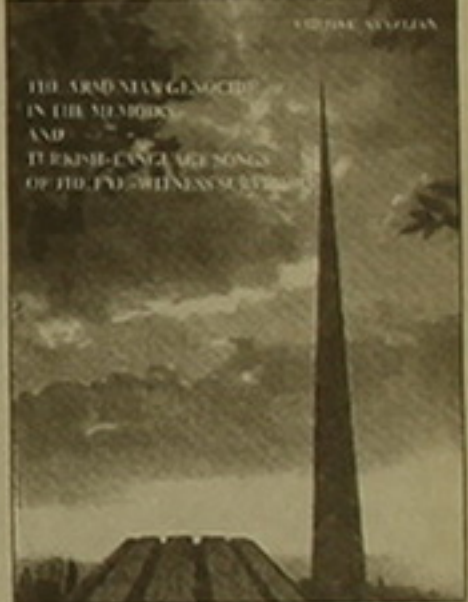
Վկան է, որն իր անմիջական, ծագիչ ու զազանական նկարագրություններով առավել խոսում, կենդանի եւ դատարանելով է դարձնում 1915-ի հրեշալու իրադարձությունները: Դատարանական ծածարություններ արձանագրող փաստաթղթերի հավաքածու չէ մեր սեղանին դրվածը, ոչ էլ անցած դեղերի վերլուծություն, այլ հրաճով մագաղան ողբ մնացած ականատեսների իհիւղությունները եւ ժողովրդական (մասնավորապես քուրալեզու) երգեր, որոնք ծագիչ են ու անմիջական, որովհետեւ ստեղծված են հենց այնտեղ, հենց այն օրերին, ամբողջ արհավիրքն իրենց մակի վրա զազանած մարդկանց կողմից: