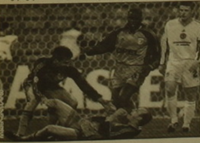
Ցեցում են «Բավարիայի» ֆուտբոլիստները:

«Բավարիա» (Գերմանիա) «Դինամո» (Ուկրաինա)՝ 1-0: Երկու շաբաթ առաջ Կիևում անցկացված խաղի հաշիվը (3-3) ուկրաինացիներին մղում էր դեպի միայն հաղթանակի համար: Եվ Սյուրինենի «Օլիմպիա»-ն ունեցավ մրցամասն սկսվեց նրանց գոհներով: Դինամոյականները զույգ խփելու հնարավորություններ ունեցան (Նեբեն հասկառոյտ այն դեպքում, երբ Վլադիմիր Բելկեյը մեն-մենակ հայտնվեց դարձախաղի առջև): Սակայն ամեն անգամ վստահ չեղողներն էր գերմանացիների դարձախաղի Օլիվեր Կանը: «Բավարիայի» ֆուտբոլիստներն աստիճանաբար հավասարեցրին խաղը, ապա եւ սկսեցին թելադրել իրենց կամը: Եվ այստեղ գլխավոր դերակատարությունը ստանձնեց Մարիո Բապտիստանը կամ ինչո՞ւմ նրան հաճախ անվանում են Սուտեր Մարիոն: Կիևում անցկացված առաջին խաղում նա հանդես չէր ելել եւ