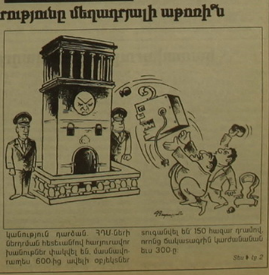
Կանություն դարձան. ՀՀՄ-ների ներդրման հետեւումով հարյուրավոր խանութներ փակվել են, մասնավորապես 600-ից ավելի օբյեկտներ

ՎԱՇԻՆԿՏՈՆ, 22 ԱՊՐԻԼ, ԱՐՄԵՆԻԱ: 22-ի վաճառականների միությունը ղեկավարում է դաշինքի 22 կառավարությանը: Այսօր միության կողմից երեւան ֆալախի Կենտրոն եւ Լուր՝ Մարա համայնքների առաջին արձանի դասարան հայ կենտրոնական կառավարության նկատմամբ: Նախադեղը չունեցող մի երեւույթ, որին վաճառականների միությունը հանգել է ՀՀ իշխանությունների սենսացիոն ֆալախականության դեմ ամիսներ շարունակվող ղարաբաղյան արդյունքում: Ինչպես արդեն մի ֆալախ անգամ սեղեկացրել է «Ազգը», նրանք ամիսը սկսած այս միությունը, որը համայնքում է առեւտրի բնագավառի փոքր միջին ընդունվածներին, խանութատերերին, կրթականներին, սարքեր միջոցներով ղարաբաղ է սկսել ՀՀ կառավարության «Հսկիչ դրամադրային ներդրման մասին» որոշման դեմ: Եվ ինչպես երկու հայաստանյայցի վաճառականների միությունում, միության կանխատեսումներն իրականացնելու համար: