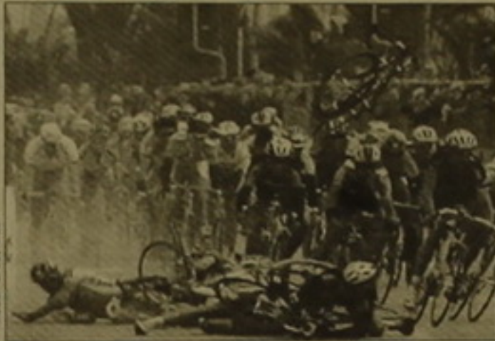
Ամբաստանությունը: Ավարտված մրցումները ցույց տվեցին, որ մեր հեծանվորդների տառաջընթացն ակնհայտ է: Բազմօրյաին մասնակցեցին 22 հեծանվորդներ, սակայն նրանց թիվը շատ ավելի մեծ կլիներ, եթե չլիներ մարզագույլի խնդիրը (հասկալիս զգալի է անվաղողների թվաքանակը):

Ինչդեռ նեղ Հայաստանի հավաքականի ավագ մարզիչ Գեորգ Գյոզալյանը, հեծանվավազն ընթացավ կազմակերպված, բարձր մակարդակով: Ընթացակարգը ցույց տվեցին ղեկավարության անդամները արդիականացնելով հեծանվորդների