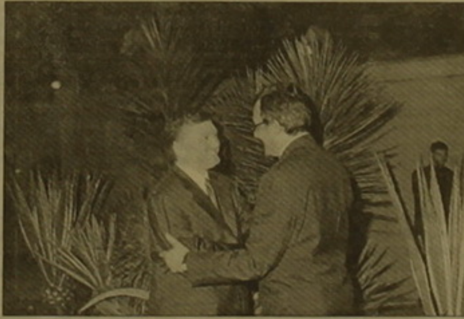
Արաֆ Հասապայի հրաժեշտ հանդիպումը Եգիպտոսի Արաքական Հանրապետության հետ, որը Կահիրեից տեղափոխվեց Փարիզ քաղաքում:

Կահիրեի կենտրոնում, Նեղոսի ափին վեր է բարձրանում Եգիպտոսի արտաքին գործերի նախարարու-թյան նստավայրը: Այնտեղ է գտնվում նաեւ ԱՊՏ երկրների զարգացման ֆոնդի նախագահ, դեպիտատ Արաֆ Հասապայի գրասենյակը: Փորձառու դիվանագետը աշխատել է բազմաթիվ երկրներում, նաեւ Մոսկվայում: ԱՊՏ երկրների զարգացման ֆոնդը ունենալով 400 մլն դոլար դրամազույն, հսկա-յական գումարներ է ծախսում դիվանագետների, սենսազիստների, բանկային համակարգի աշխատող-ների, լրագրողների, ազգային անվասնագրության համակարգում աշխատող ոստիկանների վերադաս-տիարակում համար: Դա կարելի է համարել նաեւ փոխհասցում այն անասնատնային օգնության դիմաց, որը շասնյակ տարիներ նախկին Ս. Միություն ժողովուրդներն ուղարկել էին նոյապետու այստեղ Ե-գիպտոսի Արաքական Հանրապետության: Հայաստանի շուրջ 260 աղակալացիներ, աշխատողներ մաս-նակցել են վերոհիշյալ ֆոնդի կազմակերպած վերադաստիարակական աշխատանքներին: