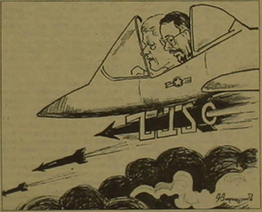
ՏԵՆ 1 Է 8

նավերին: Մյուս կողմից, սազնադատի լուրեր են հասնում Կոսովոյից, որտեղ ազգաբնակչության զանգվածային փախուստի եւ խուճապի մթնոլորտ է սիրում: Փախսականների առաջին ավիա արդեն հասել է հարեւան Հունաստան եւ Իտալիա, որտեղ կարմիր խաչի կազմակերպությունները զբաղված են նրանց դասարանելով, ըստ ՌԲԻ ռադիոկայանի փախսականներից ցուր 2000 մարդ ժամանել է Թուրիա: Լոնդոնը երեկ երեկոյան Բելգրադին մեղադրեց ոչ միայն Կոսովոյում, այլեւ Ալբանիայում «խաղաղ» գյուղեր ուժարկոծելու, ինչպես նաեւ 36 ալբանացիների զնդակահարելու մեջ: Այլ աղբյուրներ չհասասեցին այդ տեղեկությունները: