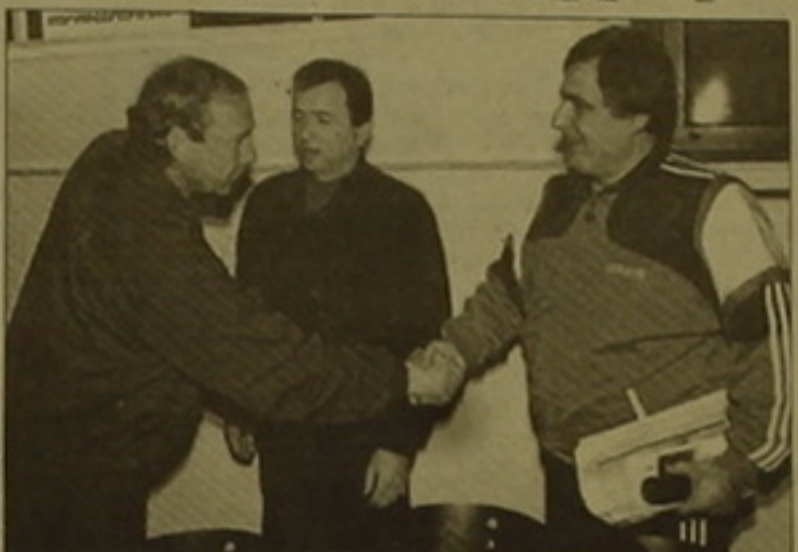
Հավաքականների գլխավոր մարզիչների բարեկամական ծնոթեղմունք

Հայաստանի ֆուտբոլի ֆեդերացիայի լրացված բաժնի նախածնունդով երեկ մամուլի ասուլիս անցկացրեցին եվրոպայի առաջնության 4-րդ ընտրական խմբի այսօրվա մրցակիցներ Հայաստանի և Ռուսաստանի ազգային հավաքականների գլխավոր մարզիչները: «Այն էլ էլ են» համալիր տրախ, որտեղ կայացավ ասուլիսը, լեվիզեցում էր: Ընդ որում, Հայաստանի ու Ռուսաստանի լրագրողների բացի ներկա էին նաև այլ երկրների ներկայացուցիչներ: Իրոք որ հեծաբերություն այս խաղի նկատմամբ հսկայական է: Դա զգացվում էր եւ հարցերից ու դասախոսներից, եւ այն մթնոլորտից, որ սիրում էր տրախում: Երկու հավաքականների մարզիչներ էլ նեցցին, որ թե քիմերի ղեկավարները, թե խաղազոտները մի առանձին սրամաղվածությամբ են դասարանվում այս հանդիպմանը: Սուրեն Բարսեղյանը սկզբից եւթ նեցց, որ ծագումը նախեստված հունվար-փետրվար ամիսների հավաքները չանցկացվեցին քարքեր դասախոսներով: Միայն փետրվարի վերջին թիմը հավաքվեց (այն էլ ոչ լիվ կազ-