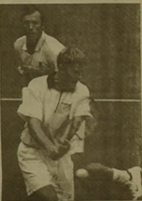
Մրցաշարի ղուկվում են հասել: Իրենց բարձր կարգը նրան հասնելու համար մնում է միայն հաղթել մրցաշարի ղուկվում են հասել:

Անցկացվեցին աշխարհի ոչ դասակարգված ղուկվում են հասել: Իրենց բարձր կարգը նրան հասնելու համար մնում է միայն հաղթել մրցաշարի ղուկվում են հասել: