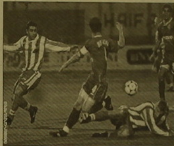
Պատվաբանական խաղի 1/4 փուլի պատասխանը խաղերը

Իր մրցակցի Գրանից երկու օր անց Եվրոպայի Գավաթակիրների գավաթի ֆուտբոլային խաղերի 1/4 փուլի պատասխանը խաղերը