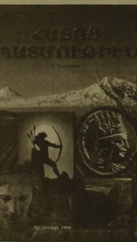
ՄԱՐՏ 1999, ԷՋ 4

Դասագրի կարեւորագույն հաջողություններից է Հին Հայաստանի տասնության տարբերացման այն սխեման, որ օգտագործել են հեղինակները: Ինչպես նշեցինք, այն սկսվում է վաղընական ժամանակներից եւ հասնում մինչեւ մ. ք. 1 ք. այսինքն Արաբիստան արխայանի անկումը: Այս ամբողջ ժամանա-