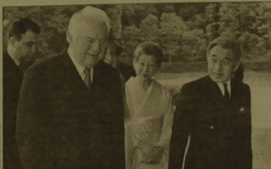
ՄԱՐՏ 8, 1999

ՏՆՄՈՐ 8 ՄԱՐՏ, ՍՏՄԲ: Վրաստանի նախագահ Էդուարդ Շեարդսոնը կրակաճառի հերքել է Վրաստանի արածում բուրգական ռազմականները սեղաբաշխելու հնարավորությունը: «Այդ հարցը երբեք չի կենտրոնացել, եւ բուրգական կողմը երբեք նույնիսկ չի ակնարկել նման հնարավորության մասին», հայտարարել է լուսաբանական այցով ՏՆՄՈՐ-ում գտնվող Էդուարդ Շեարդսոնը: «Պրաստիաններով Վրաստանի արածումն ուսուցանող ռազմականները վերացնելու Թբիլիսիի մտադրության մասին մամուլում հայտնված հարցումներին առնչվող հարցին Էդուարդ Շեարդսոնը ասել է, «Պրաստիանները գոյություն ունի, ճիշտ է վավերացված չէ: Առկա են համապատասխան լուսաբանումներ, երբ մեք ստորագրել ենք լուսաբանագիրը, հարկավոր է դրան կասարել»: Վրաստանն ու Ռուսաստանը նոր հարաբերություններ են կառուցում, թե՛ որոշ խնդիրներ լուծելու համար «ժամանակ կողահանելով», նեւ է Էդուարդ Շեարդսոնը: Պր-