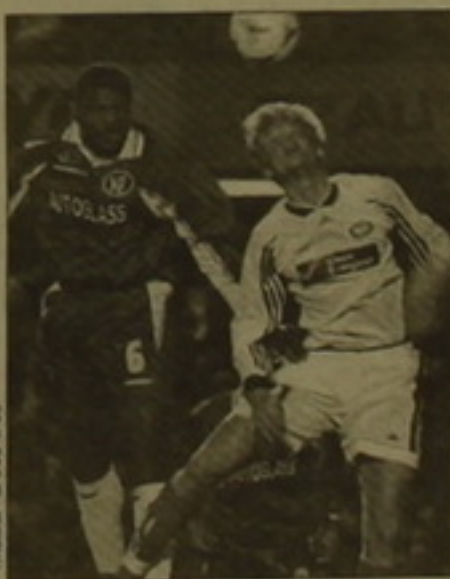
Ֆուտբոլիստներով համարվել գրում է Լոնդոնի «The Times» թերթը: ԱՐ. ԱՐ.

րեք հնարավոր չէ հսկել ֆուտբոլիստի օտար դաշտում, ովքեր արագ և հեծ վասակելու մոտից ունեն: Ֆուտբոլիստը գեղեցիկ խաղ է ցուցադրում, և օտարները կարծում են, թե նա կարող է ամենուր տեղափոխվել: Ես մի կարծիքով եմ գիտնում, որ Եսայանը այսօր երեկոյան տուն է գնալու, իսկ վաղը գալու է մարզումներին: Ի դեպ, Բեսեգան «Արսենալի» փոխնախագահ Դեյվիդ Դեյնի մոտ ընկեր է, և կարծիք կա, որ Լոնդոն կասարած նրա այդ գոյություն ունեցող ակումբը է: Ամեն դեպքում, «Յուվենտուս»-ը Իստանբուլի առաջնության միջնամասում է բավական ես մնալով առաջատարից «Լացիո»-ից, և մինչև ամառ չի դաշտափոխվում նոր