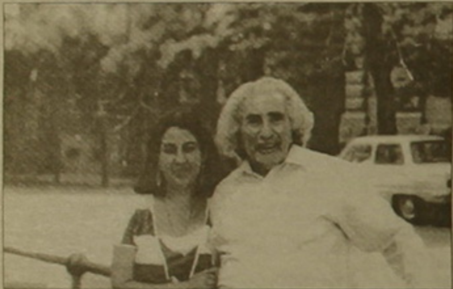
Գուսան Շահենը երիտասարդ տարիքում

Գուսան Շահենի ծննդյան 90-ամյակին ընդառաջ