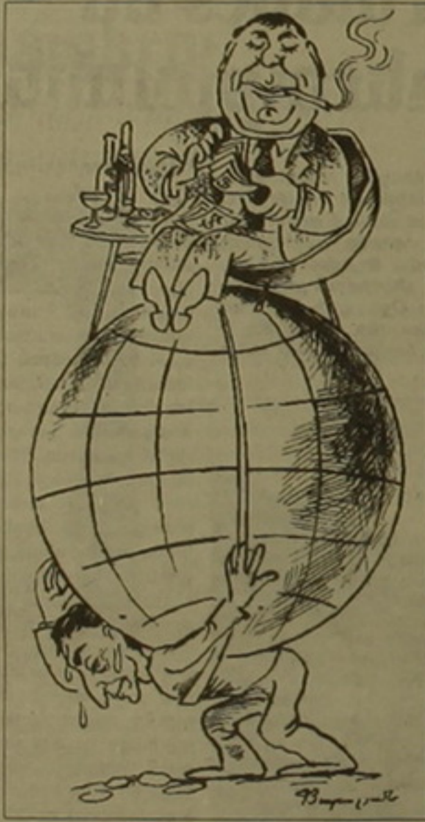
Մարդ կա աշխարհն է շալակած շանու Մարդ կա էլէլ է շալակե աշխարհի:

«Անլուելին» ծնող անլուելի ծնունդ էր: Գրական այս երեւոյթն իր գրական ժառանգորդներն ու ժառանգուհուն ունեցավ եւ հայ գրականության մեջ, եւ հենց իր դոկտեային: Պոեզին հաջորդե- ցին երկու անլուելիներ՝ գլուխգործոցները՝ «Մարդը ափի մեջ» եւ «Եղիցի լույս», որոնց ծնունդը օտս էր դժվար եւ կեսարյան հասունե- րով կասարվեց: Սեւակում մարդն ամեն ինչի մեջ էր, բացի ինքն իր մեջ լինելուց: Մարդուն տեղա- վորել իր իսկ ափի մեջ, իմա՝ նրան դիտել որդես մարդու՝ վեր կանգնած ամեն ճեսակի դայամանա-