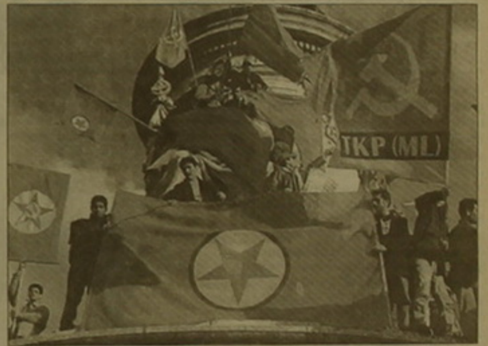
Քրդերի ցույց Փարիզում

Այսօր քուրական կառավարությունը կարող է հավակնել, թե նաեւ ինքն է հարթանակել սառը դասերգծում: Արդ, Արդուակի Օզալանին ձերբակալելն ու քուրական բանտ փոխելը մի ցավազին էքն է սառը դասերգծի դաստնության, որի ընթացում Մոսկվան ու Դամասկոսը մի կողմում էին, Անկարան մյուս: Օզալանը խաղաղութեանը մեկն էր ընդդեմ Անկարայի, ուստի: Այլանջան ուխտի: Խորհրդային Միության փլուզումից հետո