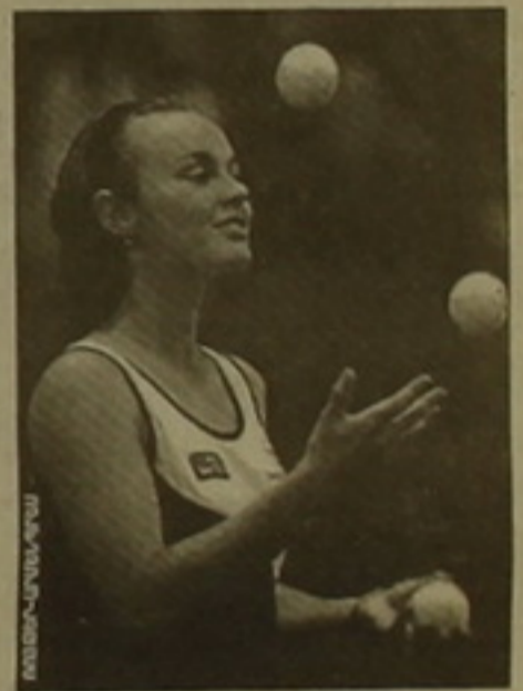
Մարինա Հինգիս (ԱՄՆ)՝ 5547, 3. Յանա Լոփոսնա (Չեխիա)՝ 3850, 4. Մոնիկա Սելե (ԱՄՆ)՝ 3823, 5. Մանուսա Սանչես-Վիլարիո (Իսպանիա)՝ 3067, 6. Կենուս Ուիլյամս (ԱՄՆ)՝ 3014, 7. Շթեֆի Գրաֆ (Գերմանիա)՝ 2743, 8. Պասրիսա Հնայդեր (Եվրոպա)՝ 2310, 9. Մերի Պիտ (Ֆրանսիա)՝ 2248, 10. Լասալի Տոգյա (Ֆրանսիա)՝ 2161 միավոր: