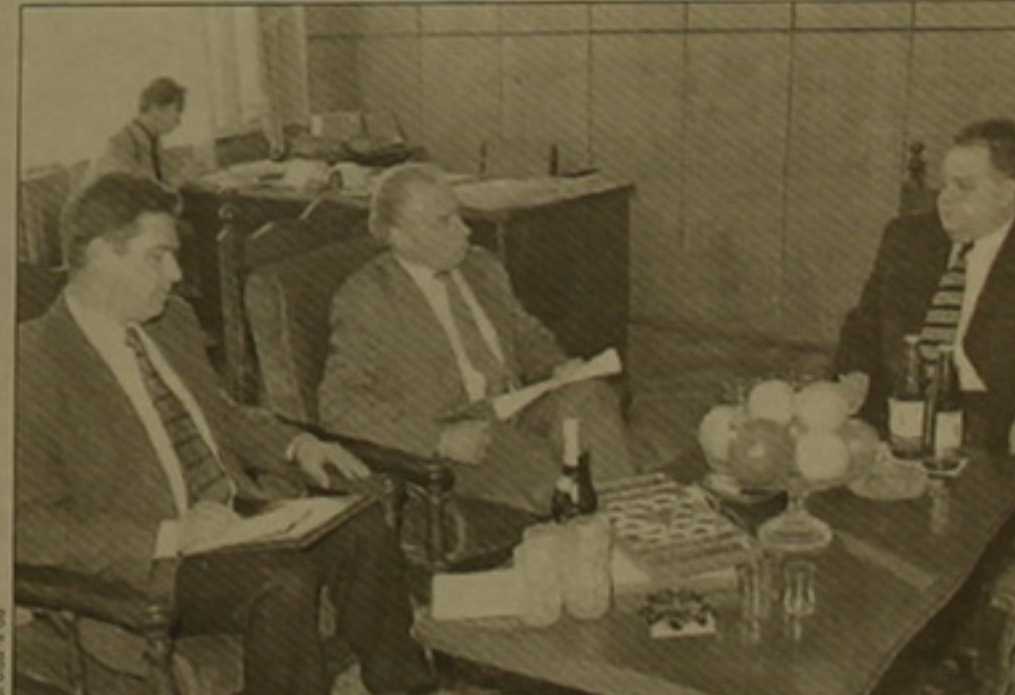
Բաղափական կուսակցությունների առումով բազմազուն Լաւրեզ ունի, ինչն, ըստ դեպտանի, ֆաղափականության զարգացման օնալ գրավականներից մեկն է: Սակայն որն Դրուկովինը նաեւ բացառաբար արտահայտվեց ցանկացած բնույթի ծայրահեղականության վերաբերյալ՝ ակնարկելով նաեւ

ՀՈԱԿ-ում ծագած վերջին լրագրությունը: Դրվասանով արտահայտվելով ՀՈԱԿ ներկայիս ղեկավարության խաղաղարար ֆաղափականության մասին դեպտանը հետաքրքրվեց Ամ առաջիկա ընտրություններին ռազմավարների դիրքորոշմամբ: Պրն Միր-