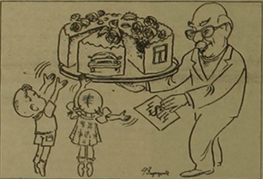
Չեղարկելով իր ժառանգության իրավունքը, կտակատուի կամից անկախ ժառանգատուի կամից անկախ ժառանգության դաշնային բաժնի ժառանգի իրավունքն է՝ կտակի բովանդակությունից անկախ ժառանգման այն գույքի առնվազն կեսը, որը նրան կհասներ ըստ օրենքի ժառանգելու դեպքում (նախկինում այդ բաժինը 2/3 էր):

Բաղադրական օրենսգրքի նաև անարժան ժառանգատուին ժառանգությունից մեկուսացնելու մեխանիզմ է սահմանում այն ան-