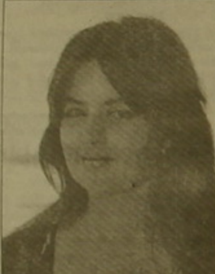
դու ինքդ կկարողանաս դառնալ անեգրական...

Տղա եւ սեպտեմբերի մի աղջիկ զգույս բռնել էին միմյանց ծեփից ու նայում էին իրար: Արիւն ոչինչ: Ամեն ինչ մաքուր էր, հասկանում ես, ու ամեն ինչ ծեփից: Պատավոր զգամարդիկ փակ սենյակում արագարագ գնում, գալիս էին, իբր թե Բայց, Աստված վկա, նախանձում էին այդ տղային, որ Լուրյուն, զգույս բռնել էր սեպտեմբերի աղջկա ծեփը եւ խոսքեր չէր կարողանում ասել: Եվ ի՞նչ ոչինչ ասվեց: Բոլոր խոսքերն արդեն ասված են: Մնում է միայն երբեմն երբեմն կրկնել, որ ոչինչ չէր լինում, որպեսզի Թոմ Թեյսի վազը միտք արթուն մնա մեր մեջ: