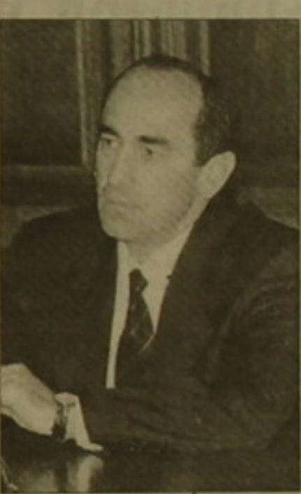
Sbu • էջ 3

կան զարգացումների միտումները: Դատախազական մեքանիզմը յուրաքանչյուրի երկուական հարցի, որն Բոչարյանը դրսևորեց ներկա իրավիճակում իր քաղաքական ընդդիմադիրների նկատմամբ բավական հանդուժողական կեցվածքով: Օրինակ, անդրադառնալով Անդրանիկ Սարգսյանի հանրահայտ «եթե»-ին (եթե նախագահը չեղծվի արցախյան հարցի լուծման ուղուց եւ իր նախընտրական խոստումներից Հանրապետական կուսակցությունը կարունակի սատարել նրան), նախագահն ասաց, որ «այս իրավիճակում նման «եթե»-ների առկայությունը բնական է համարում», եւ ավելացրեց, որ ինքը հարցադրման «Ֆոնը դրական է զնահատում», իսկ նախընտրական խոստումներից շեղվելու որեւէ նպատակ չունի: