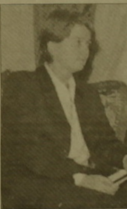
գույլագումը: Տուղի ՕՔոնորը նեճ, որ այս սարվա բյուջեի կաճարողա-կանում վերջին երկու ամիսների կս-րվածով ճհաճ անակնկալներ կան եւ իրաճարափությունը կառավարությունը չի կարողանում հավաել օրենով ամրագրված եկամուսները, ուսի ե սկսվել են բյուջեճային լվճարումնե-րը, բյուջեն նորից ղաճրեւ է կուսա-կում: Բայց ՀՔ ղաճսվիրակությունը հուսով է, որ այս լվճարումները կհողբախարվեն:

գանի, աղա գալիճ Եարա իրեն կղիմեն ՀՔ սնորնների խորհրդին, եւ վերջինս էլ առավելագույն երկու Եարաճ ընթացում 2000 ք. հունվա-րին Հայաստանին կհասկացնի 1999 ք. բյուջեի դեճիցիսի ճաճմանն ուղղված SAC-3 վարկի վերջին ղա-փարաժինըճ 17 մլն ՏՃՐ, որը 25 մլն դոլարից փոր-ինչ ավելին է: Տուղի ՕՔոնորն աղեն հանդիտել է Ֆի-նանսների, էկոնոմիկայի, գյուղաճն-ճետության եւ էներգեթիկայի նախա-րարներին, վարչաղեճ Արամ Աար-այանին եւ որղեճ եզրափակումճ նա-խագահ Ողբեր Քոլարայանի հեճ: Բն-նարկումների առանցում ոչ միայն կաոողվածային բարեիտյումների վարկն է, այլեւ Հայաստանի հեճազ համագործակցությունը ՀՔ-ի հեճ: Այդ համագործակցությունը միջա-մուխ է որակական մի նոր աճիճա-նի. «Գաեւ րաղեն մեր անցյալի հա-մագործակցության փորճիցճ, ժղի-ճով հավասխարեց Տուղի ՕՔոնո-րը: 93 ք-ից առ այսօր ՀՔ Հայաստա-նին սրամադրել է 535,5 մլն դոլար Ֆինանսական միջոցներ, որից 265,8 մլն-ը կաոողվածային բարեիտ-յումներին է ուղղված եղել (SAC վարկերը): Հեճեարա Հայաստանի համար իր բյուջեի դեճիցիսի ճաճ-կումը մնում է հիմնական խնդիր, ցա-վոճ, նաեւ 2000 ք-ին: