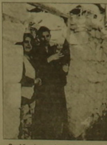
Քարինակ գյուղի ամենաուկուց բնակիչը 93 տարեկան է, որը գյուղամիջյան կանգնած տարեցներից ամենապալուն էր իսկ ամենափոքրը մոտ 10-ից մոտացող այս տղան է: