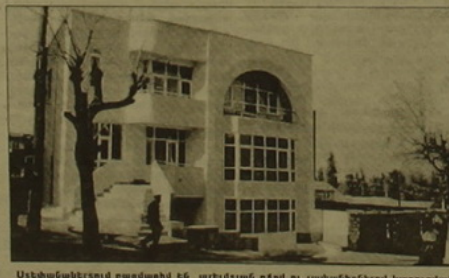
Սեփականակերտում բազմաթիվ են արեւմտյան ոճով ու չափանիւներով կառուցված ու արդեն դաշտարս եմք նորակառույց եւները: