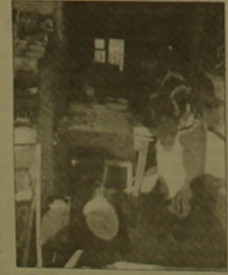
Այս կինը գտել է իր աղբուսի միջոց շուքուում թիւում ու վաճառում է արցախցու ավաղակակ միջոցալով հաջող ու մաշտարսման համար զգալուն վճարում ու անընկալ 13 տաակի կառայի: