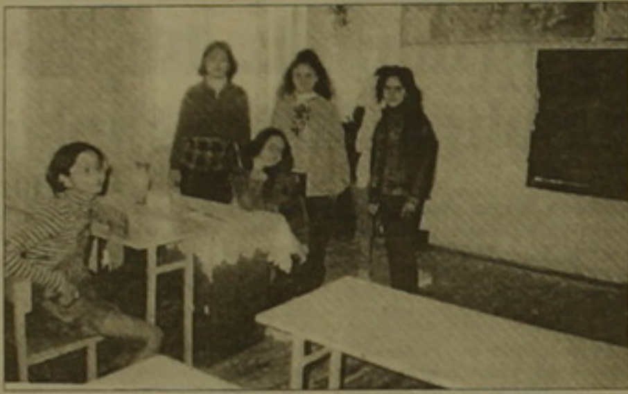
Սեփականակերտի Թ-ը գյուղի մի խումբ աւակերտներ: Այս գյուղում են աւարել ՀՀ եւ ԼՂԿ Երկրայի նախագահները: «Մեք տարաւս եմք այստեղ՝ «անցնել» եւ «արտահանել» նախագահները: Կատակերից հոգրոցում:

ւի այդ սեղեկակները կարծես թե դարձել է այն սանդղակը, որը ցույց է տալիս ժողովրդի հասարակությունն ու վստահությունները: Կառավարությունը մինչեւ 2001 թվականը կսկսի իրագործել նաեւ բնակավայրերի զարգացման ու խնամելու ցի համալիր ծրագրեր, թեեւ որոշ բնակավայրերում արդեն դրան սկսված կարելի է համարել: Այդ ծրագրերից է կախված նաեւ հանրապետության բնակավայրերի բնակչության թվի ավելացման ու վերաբնակեցման խնդիրը: Կառավարությունը մտակել է վերաբնակեցման ծրագրի, ըստ որի մինչեւ 2010 թվականը ԼՂՀ նվազագույն բնակչությունը դրեն է լինի 300 հազար: Ծրագրով շուքը դրվելու է հասկալոյս 25 գյուղերի վրա, որոն-