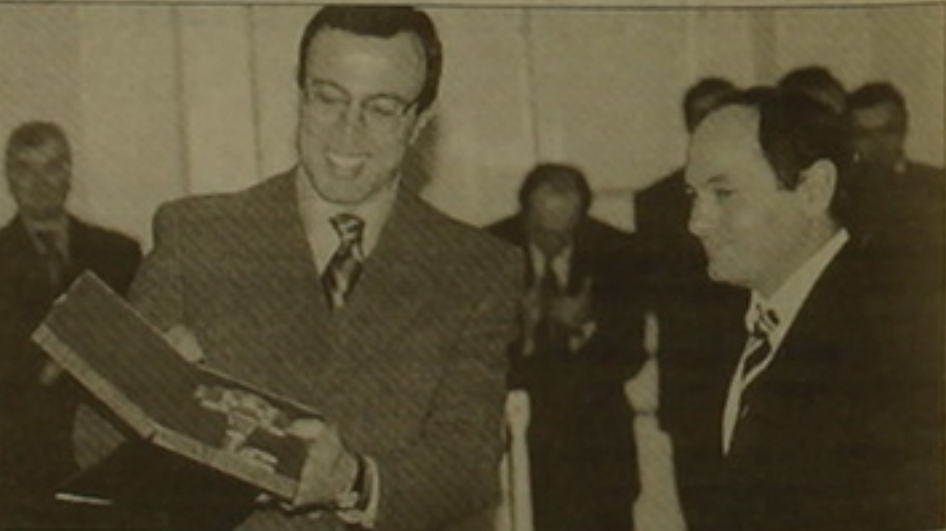
Նախագահ Սոյժանովը ցույց է տալիս ֆաղափառք Բազեյանից ստացած խորհրդակցական բանալին

Խոսրով Հարությունյանից ակնարկում էին կուսակցական հարցերի դատախազներ եւ նախարարի վերաբերմունքը՝ համայնքային կյանքում կանանց մասնակցության հարցին: Պե՛տր Հարությունյանը համաձայն էր, որ համայնքներում ժողովրդի ակտիվությունը նվազել է այն աստիճան, որ 8 համայնքներում անգամ համայնքապետի թեկնածու չի առաջարկվել, իսկ 250-ից ավելի համայնքներում ավագանիներ չեն առաջարկվել: Նախարարը համարեց, որ բարեփոխումները ղեկ է սկսել սեղական ինքնակառավարման մարմիններից՝ առաջնահերթ լուծելով արդարության խնդիրը, որի լուծումները, նախայն, ղեկ է վերցրել երկրի տնտեսության բարելավման մեջ: Պե՛տրյան կողմից համայնքներին Հիմնականում իր հարցադրման նախարարը հակադրեց իր տեսա-