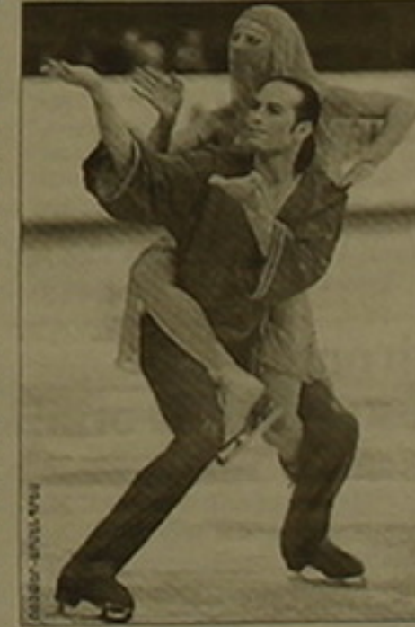
ԲԱՏԻՆԸ ՎԱՐՈՒՄ Ե ՈՒԱՅԻԿ ԱՎԱԳՅԱՆԸ

Չորս մրցածներից երեքում հաղթող նանակվեցին Ռուսաստանի գեղաստանի հորդները: Կանանց մենաստեղերում առաջին տեղը գրավեց Իրինա Սլուկայան: Պասվո թասվանդանի երկրորդ եւ երրորդ տասնամյակները եւս գեղեցիկ ռուսաստանցի աղջիկները, երկրորդ տեղում է Յուլյա Սուլոսովան, երրորդում էլենա Սուլոսովան: Տղամարդկանց մրցախաղում հաղթեց Եվգենի Պլուցենկոն, իսկ երկրորդ տեղում մեկ այլ ռուսաստանցի է Ալեքսանդր Աբս: Մորսային զույգերի մրցումներում ուժեղագույնները բացակայում էին, ինչը Մարիա Պետրուկուսովան, երրորդում էլենա Սուլոսովան: Պարային զույգերի մրցակցությունում անտախտիներն առաջին տեղը գրավեցին իսպացիներ Բարբարա Յուլյա Պոլին եւ Մաուրիցիո Մարգալին: Հաղթողներ իրենցից եւս թողեցին կանադական Շելլի Քլոուն-Վիկսոն Կրաքց ուժեղ երկակին: