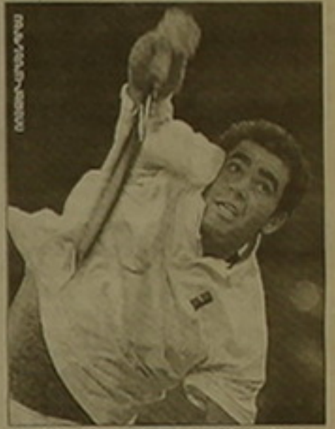
Երեք օրվա ընթացքում Մամփրաքի չեմպիոնը Ալասին հաղթեց 6-1, 7-5, 6-4 հաշվով:

Եզրափակիչ մրցախաղը ընթացավ Մամփրաքի առավելությամբ: Նա կարողացավ բոլոր առումներով գերազանցել համաշխարհային դասակարգման թիվ մեկ ընթացիկ Ալասին, հաղթեց 6-1, 7-5, 6-4 հաշվով: