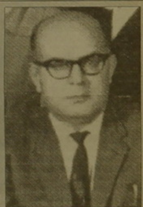
ընդառումն անուուս անչափ հետաքրքիր կլինի:

Հայրենակիցներ, ճամարիտ մեակուբականներ եւ հասարակական գործիչներ նվիրված այս մի-