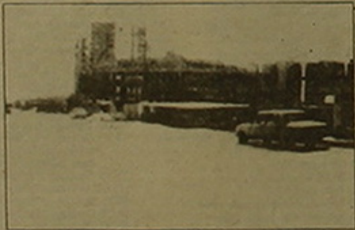
«Գյուլիմիացյան հանրապետական կայանի չորսունգ» (1. Երևան, Օտավայա Բուլվարի 22)