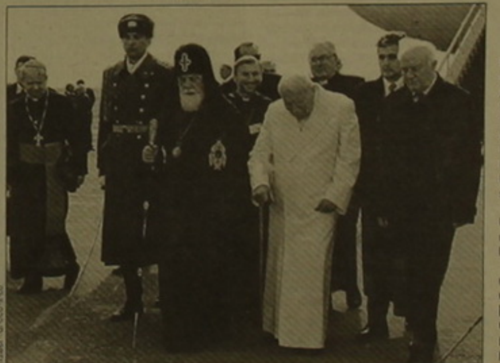
Գաղթական թաղամասի ղեկավար Կասիկանի թաղամասի կաթողիկոսությունը այսօր հասնում է Վրաստանի մայրաքաղաք Թբիլիսի:

ԹԲԻԼԻՍԻ, 8 ԱՅՆՄԱՅԻՆ, ԱՐՄԵՆՊՐԵՍ: ԻՏՍՈՒՍՍՍ: Հոռմի Հովհաննես Պողոս Երկրորդ թաղը և Կասիկանի թաղամասի կաթողիկոսությունը այսօր հասնում է Վրաստանի մայրաքաղաք Թբիլիսի: Դա հոռմեական կաթողիկոսության ղեկավար Կասիկանի թաղամասի կաթողիկոսությունը այսօր հասնում է Վրաստանի մայրաքաղաք Թբիլիսի: