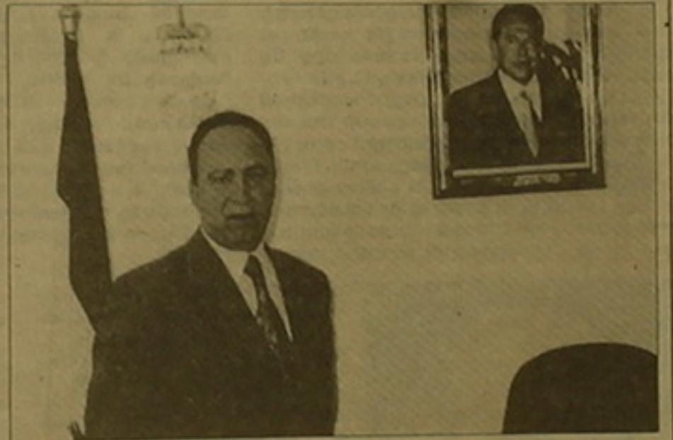
Հայաստանում Լիբանանի դեսպան Թոնի Բաղաձին Լիբանանի Կառավարության նախագահ զեներալ Էմիլ Լահուդի գեներալի առջև:

Այս բոլոր փոփոխությունները կապված են Լիբանանի 36-րդ տարեդարձի հետ: Այս օրը Լիբանանի անկախության 56-րդ տարեդարձի առիթով ուզում են անդրադառնալ հայ լիբանանյան շահագրգիռ հարաբերություններին: Լիբանանը կարելի է երկու երկրների հարաբերությունները բազմաթիվ դասառնություններով դասակարգել: Այս օրը համայնքը անհրաժեշտ է երկրում: Այս համայնքն անբաժան մասն է լիբանանյան հասարակության, սոցիալական, մշակութային, ֆուրաբական բնագավառներում: Լիբանանի հարաբերությունները Հայաստանի եւ հայ ժողովրդի հետ հարյու-