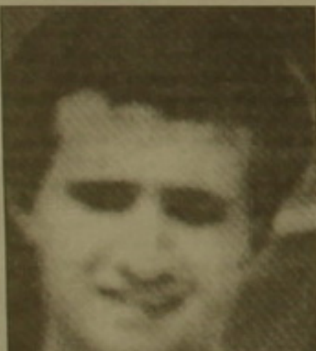
Ահաբեկչության զոհերի միջև

Վերջին օրերում Երևանում տեղի ունեցած ահաբեկչությունը և հեղափոխության փորձը միմյանց հակադրվում են: Մի կողմից՝ ահաբեկչություն էր կասարվածը, թե՞ հեղափոխության փորձ: