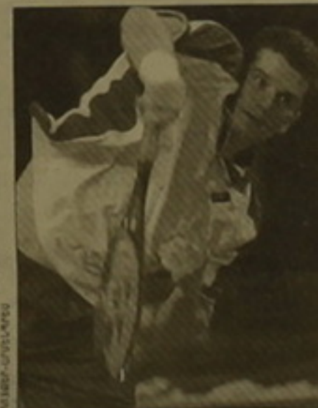
Փարիզի եզրափակիչ մրցումների քո- լոր մասնակիցները:

Մարկ Ֆիլիպուսիցը (Ավստրալիա) Նիկոլայ Եսկուրովին (Ֆրանսիա) 6-4, 7-6, Մայլ Զանգը (ԱՄՆ) Թո- մաս Յուհանսոնին (Շվեդիա) 6-7, 7-5, 6-4, Ֆարիս Սանսոնին (Ֆրան- սիա) Ռայներ Շուսլերին (Գերմա- նիա) 6-2, 6-3: Հաջորդ փուլը են մտել նաեւ Զիմ Կուրյեն (ԱՄՆ), Ալ- բերտ Կոստան (Իտալիա), Լեյթոն Զյուլիցը (Ավստրալիա):