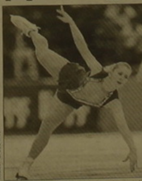
Միսել Կվանը (ԱՄՆ): Նա երկրորդ եւ երրորդ տեղերում թողեց Ռուսաստ- անի մրցուկները:

Կոլտարդ Ափրինցը ֆաղափում անց- կացվեց գեղասահի համաշխարհային «Մեծ մրցանակ» ժամանակահատվածի «Սեյնթ Ամերիկա» մրցաշա- րը: