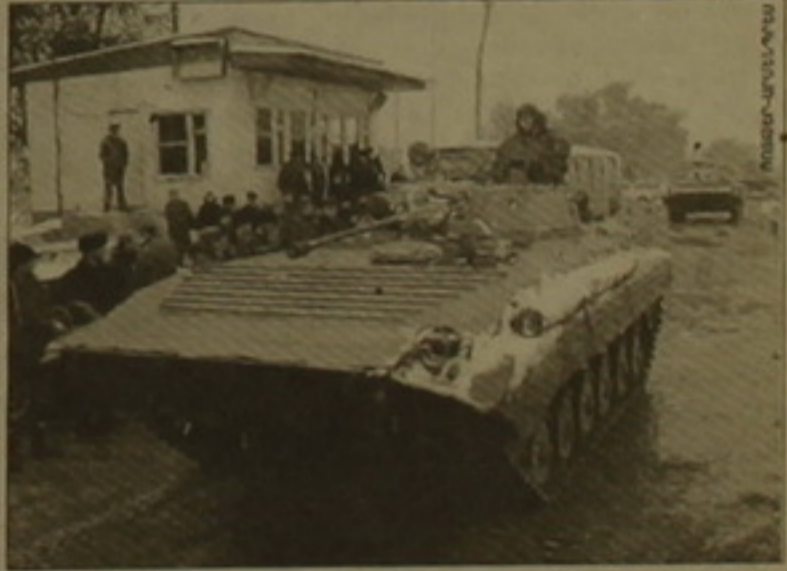
Ռուսական անկային գրադարարությունը արարվում է դեղի Չեչնիա

ՄՈՍԿՎԱ, 12 ԱՅՏԵՐԵՐ, ԱՐՄԵՆԻԱ։ Այսօր առավոտյան սկսվեց Գուղերմեի համաեղ մամրուլը համերկային գորերի, միլիցիայի եւ սեղի զինված կազմավորումների ուժերի կողմից, «փաղաում րարձրագվել է Ռուսաստանի դրոգը»։ Այս մասին լրագրողներին հայտարարել է Ռուսաստանի կառավարության նախագահ Վադիմիր Պուսինը։ Ըստ ԻՏԱՆ-ՏԱՄԱ-ի հաղորդման, վարչապետն ընդգծել է, որ անփոփոխ են մնում Չեչնիայում համերկային ուժերի նախկին ժադրերը։ Նա ընդսմին դարձաբանել է, որ «մեմ փաղաի դեմ խոտուրմասեար գրոհների խնդիր չեն դրել, երբ կարող էին ավելի արար զոհեր լինել խաղաղ բնակիչների եւ զինմաայողների արանում»։ Վադիմիր Պուսինը հայտարարել է, թե Չեչնիայի նկատմամբ Ռուսաստանի ղեկավարության նոյաստակը նախկինն է «վերջ տալ ահարեկությանը եւ չեչնե ժողովրդին ազատել Չեչնիայի արարծն օկուդացրած ելուզակային կազմավորումներից»։