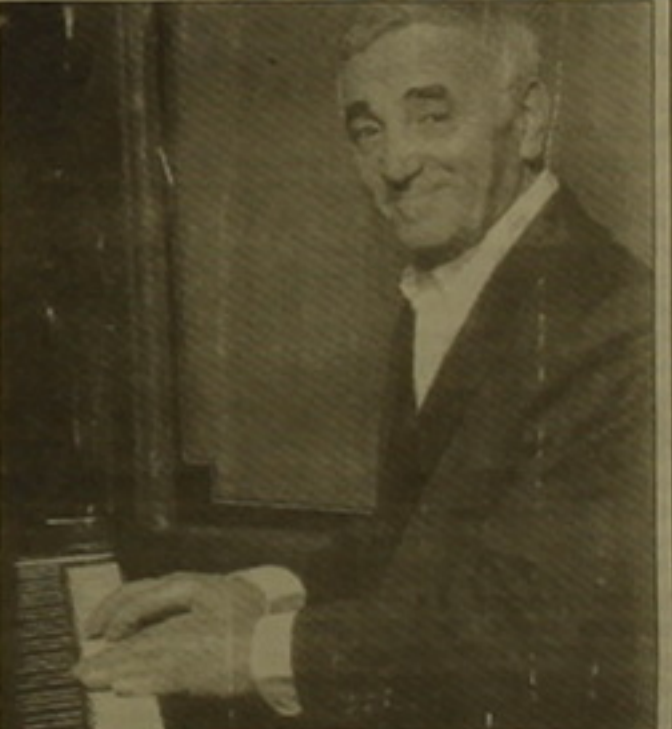
Տես է էջ 4

- 1999 թ. համար Չեր մադրանն այն է, որ Ֆրանսիայի Սենատը ճանաչի Չայոց ցեղասպանությունը: Այդ մադրանը ցույց է տալիս Չեր անմահողը նվիրումը Չայ դաշին: Նկատի ունենալով այն փաստը, որ, ինչպես գրում է ռուսական «Էֆիր» թերթը, Չեր անունը Ֆրանսիայի խորհրդանիշն է դարձել, իսկ Ֆրանսիացիների համար խորհրդանշում է հայ ժողովրդին, մտադիր է Չեր համաբարհային համբավն օգտագործել Ֆրանսիայի իշխանություններին աշխուժացնելու համար, որոնք այնքան էլ չեն բախում Սենատում վերադարձնելու անցկացնել: