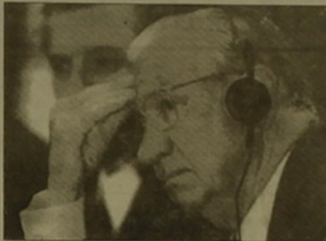
Պայի անցկացման համար Մամարանչը նախընտրեց «Կոկա-կոլայի» ֆաբրիկայի ֆեշակները, մինչդեռ ավելի ծիծեռ և խորհրդանշական կլինեք այդ օլիմպիական անցկացման օլիմպիական բարձրագույն հայրենիքի արժեքները:

Կասալոնիայի մամուլում նա «Քամելոն» մականունն է ստացել: 78-ամյա մարիո Լուան Անտոնիո Մամարանչը գեներալ Ֆրանկոյի օրոք բարձր դասեր էր զբաղեցնում, իսկ հետագայում որդեգրեց օլիմպիական բարձրագույն գաղափարները և ի վերջո դարձավ ՍՕԿ-ի նախագահ: Նա կյանքում բազմից էր ծախսել: Օժտված լինելով ցինիզմով և փոխակերպման տաղանդով, համախառնաբար ստորի դեկլարացիան վերջին անգամ գործարարի կոսյուկը փոխեց սոցիալական արժեքների համազգեստով: ՍՕԿ-ի 114 անդամներից 8-ը արդեն ռուսներ են ուսանողներ կասալոնիայի փոխակերպման դասընթացում: Նրանցից 6-ը հունվարի վերջերին դասընթացի արվեստը այն բանից հետո, երբ հետախույզները հանձնարեցին արդարացի, որ նրան կառավարի դիմաց փեշակներ են 2002 թ. ծննդյան օլիմպիական խաղերը կրկին ամերիկյան Սոլթ Լեյք Սիթիում անցկացնելու օգտին: Մյուս երկուսը նախընտրեցին կանխել դասավորելու և հրաժարվելու: Երկուսը, որ Բելյուգարացի Մարկ Չոլիերի վերջին կասալոնիայի բացահայտումները կարող են ՍՕԿ-ի համար իսկական աղետի վերածվել, Մամարանչը հայտարարեց, թե դասընթացներին խնդրելու է այս օրվա մարտին կայանալի փեշակների թվաքանակը դասընթացի վրա մասնակցելու: Սա աննախադեպ երևույթ է ՍՕԿ-ի դասընթացում: Սա աննախադեպ երևույթ է ՍՕԿ-ի դասընթացում: Սա աննախադեպ երևույթ է ՍՕԿ-ի դասընթացում: