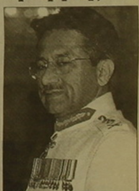
Փերվեզ Մուսաբաջ որն այսօր հեռուստատեսությամբ հայտարարել է Պակիստանում արտակարգ դրություն է հրահանգելով:

ՆԱԿԵՆԱԿՆԱԿ, 15 ՀՈՒՍԱՅԵՐԻ, ԱՐՄԵՆԻԱ ՓՐԵՍՆԱՆՈՒՄ: Գեներալ Փերվեզ Մուսաբաջի հրամանագրի համաձայն Պակիստանում այսօր զիբեր արտակարգ դրություն է մտցվել: Այն ուժի մեջ է հոկտեմբերի 12-ից այն օրվանից, երբ զինվորականները վարչապետ Նավազ Շարիֆին դատաւարանի արեցին եւ իբխանությունը լիովին վերցրեցին իրենց ձեռք: Հրամանագրի համաձայն, Փերվեզ Մուսաբաջը ստանձնել է գործադիր իբխանության ղեկավարի դատարանությունները: Չեղյալ չհայտարարելով սահմանադրության գործողությունը, զինվորական վարչակազմը երկիրը կկառավարի ժամանակավոր սահմանադրական որոշումներով: Կազմակերպություններից զրկված են վարչապետը, համադեմոկրատիայի կառավարության նախարարները եւ նրանց ղեկավարները, ինչպես նաեւ բոլոր չորս նահանգների նահանգապետներն ու կառավարությունները: Լուծարված են խորհրդարանը եւ նահանգային օրենսդիր ժողովները: Միևնույն ժամանակ դադարեցվել է Պակիստանի նախագահի դատարանը,