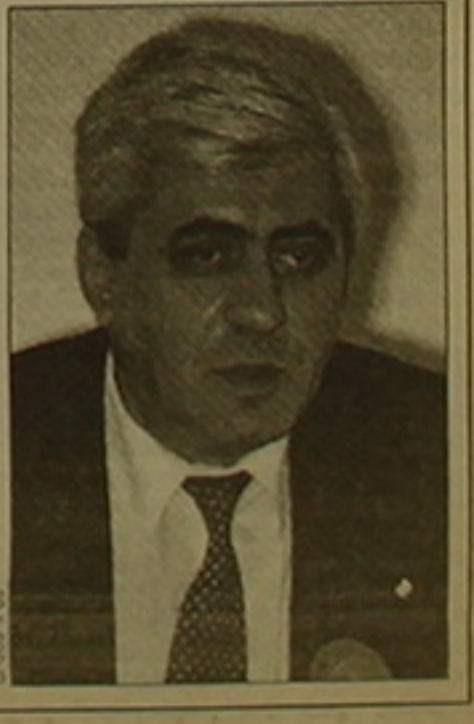
ՏԵՄ 19 Հայաստանում Դատախազի օստի. ԳՐԱՆԵՆՅԱԿ

գալ ֆաղափական հայտարարությամբ»: «Սակայն փաստ է, որ մեր երկրում ամեն մի հանցագործի կարող են դարձնել հերոս, իսկ հերոսին հանցագործ», ավելացրեց Մակեյանը: Մրտաբանության գիտահետազոտական ինստիտուտի գլխավոր բժիշկ Հայկ Բամալյանի խոսքերով, Գ. Ներսիսյանին երկու օր առաջ հիվանդանոց են բերել միկրոֆիլարիոզով: Ներկայումս նա վիճակը կայուն է, առողջության վաստարացման նեաներ չկան, բայց նա դեռ է եւս մեկ ԵԱՀԿ դատարան մնա եւ քուժվի: Գազիկ Ներսիսյանը 1991-99 թթ. Հայաստանի Գերագույն խորհրդի եւ Ազգային ժողովի երկու գումարումների դատաւարան է, ժամանակին եղել է ԳՀԿ վարչության կազմում: