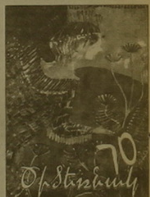
«Ծիծեռնակում»: Հավանաբար այս էր դասձուռը, որ մանկադասարանական հանդեսը ստասկված ու սիրելի է ոչ միայն փոքրերին: Շնորհավորական ջերմ խոսքերն է միանում նաեւ մեր թերթը: ՃԱԳՈՒՆԻ ԳՐԱՅԵՐ

Տոն էր «Ծիծեռնակ» մանկական ամսագրի (գլխ. խմբ.՝ Էդ. Միլիտոնյան) խմբագրասանը, այստեղ էին բոլորը՝ հին ու նոր աշխատողներ, ծանոթ-անծանոթ դեմքեր, մեծեր ու փոքրեր... Նրանց հրավիրել էր «Ծիծեռնակը», այլապես ինչո՞ք է կարելի է նշել 70-ամյա հորեւյանը: Իր հասակակիցների համար «Ծիծեռնակը» հայտնի է եղել «Հոկտեմբերիկ» անվամբ, որի ստեղծագործությունն ընդհատվել է 1941-1946 թվերին, երբ ողջ խմբագրակազմը մեկնել է ռազմաճակատ: Վերահրատարակվելուց հետո՝ 1965-ին է վերանվանվել «Ծիծեռնակ»: Մենք բոլորս գալիս ենք մասնակցությունից, եւ շատերս համար աշխարհընկալման ու ծանաչման հորիզոն է եղել «Ծիծեռնակը» եւ, ինչու չէ, որոշ մշակութային համար՝ խոստումնալից սկիզբ: Ու դաստիարական չէր, որ շնորհավորելու էին եկել բանաստեղծներ, արձակագիրներ ու նկարիչներ: Աշխարհառջակ լեռնագնաց Ռայնհոլդ Մեռնեն ասում է. «Այնտեղ՝ գագաթին չեն հանգստանում»: Չեն հանգստանում նաեւ այստեղ՝