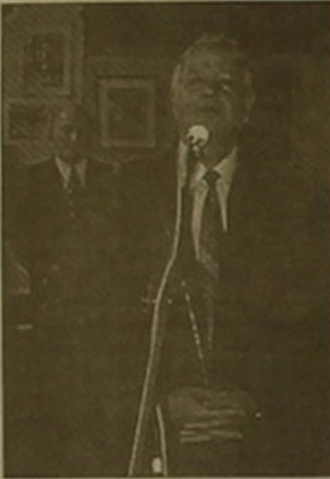
ժողովուրդ չէ: Փարիզում ապրող հայը Անն Ֆրանցիսկոյում ապրող հայը կամ Հայտերում ապրող հայը նույն բաներն ասացին այստեղ

ասեմ, որ բոլորը համախոհ էին, նույն նպատակին ծառայող: Պիտի ասեմ նաեւ, որ սփյուռը միասար