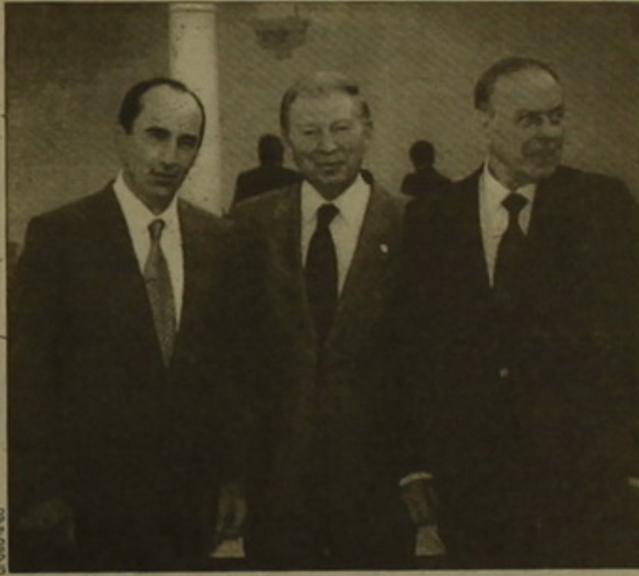
ՏԵՄ 1 էր 5

բյուն ունենալու ընդհանուր նշանակալի կայացմանը: Հաճաքողություն է հայտնվում նշանակալի Բայրյան-սեծովյան երկրների միջև երկկողմ եւ տարածաշրջանային փոխհարաբերակցի համագործակցության հաստատմանը, միասնական ուժերով այդ սարսուռում լուծելու եւ կանխարգելելու հակամարտությունները, դաժակները խաղաղություն, անվտանգություն եւ կայունություն: Որոշեց սնտեսական համագործակցության զարգացման ուղի, նշվում է էներգետիկայի, տրանսպորտի, կառուցման, բնապահպանության եւ այլ ոլորտներում համատեղ ծրագրերի իրականացումը: Պատասխանատվություն է հայտնվում համագործակցելու եվրոպական եւ ծեւալորվող եվրո-ասլանայան կառույցներում մասնակցի երկրների ներստի ամրադնդման ուղղությամբ, համատեղ ժայրարելու ահաբեկչության, ադրբեյջանի միգրացիայի, բմանյութերի եւ զենի ժրանառության դեմ: