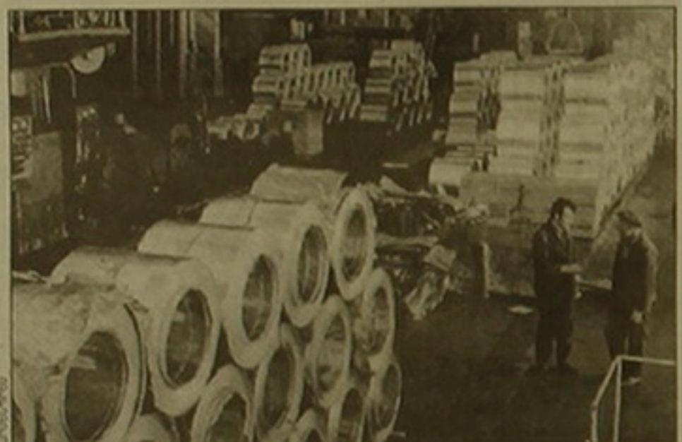
Մովսիս Գրիգորյանը: Մովսիս Գրիգորյանը

սես Չավարյանը՝ այսօր կառավարությունում կայանալի «Կանաչ» այլուսինի գործարանի սեփականաւորումն հայեցակարգի Բնարկման նախօրեին: «Ազգը» քազմիցս անդրադարձել է Հայաստանի արդյունաբերության և սննտության ղարազման համար մեծ հեռանկար ունեցող այս ձեռնարկության ներկային և աղազային: Գործարանը շուրհիվ ղեկավարության ջանքերի դախողանվել է և համեմատաբար բարձր վիճակում է, սակայն ես որոշ ժամանակ անց արդեն հնացող սարավորումներն ու հոսագծերը կդառնան իրենց դարն ի տղա աղազ, և ամենակարեւորը հմուտ մասնագետները կկորցնեն իրենց որակավորումը: