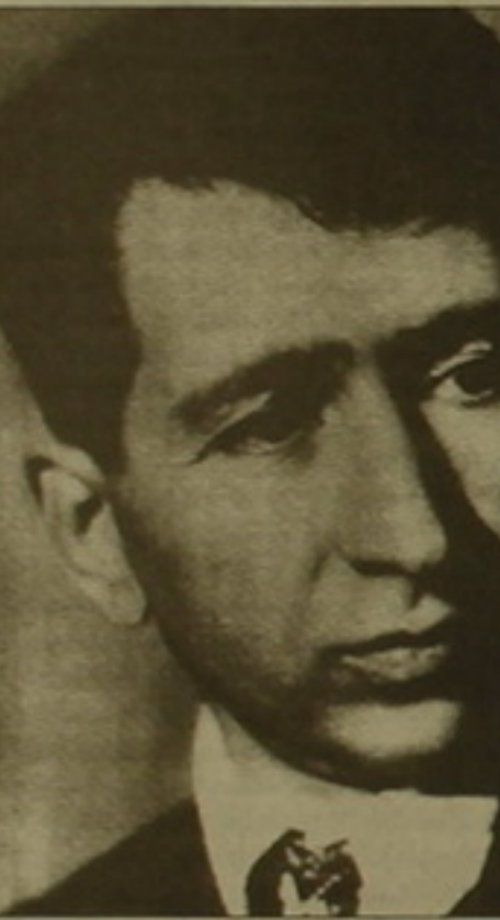
րադախորեն իրենը Զարենցինը համարել:

Զարենցը փոխեց իր ոճը, գրեց ոչ իր նման, խոսեց ոչ իր սովորական ձայնով ու ինչեւանգով: Կարեւորը վերջին խոսքը լինել ասելն էր: Եվ նա ասում էր երբեմն հասարակ, անզարդ շարադրանով, երբեմն ժողովրդականի ու գրականի խառնուրդով, երբեմն էլ սխալելի, հուզական ու արժանու մի ոճով, որի մեջ, ինչպես ծիածանի, ներխուս