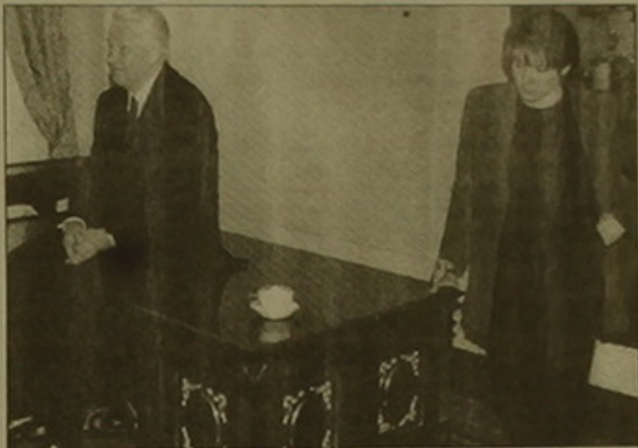
Ելցինը դառն Տասյանայի հետ

Ճրանսիական «Պուեն» հանդեսի ժնեփյան թղթակցի օրեր հաջորդվել է բացահայտել այդ 22 ռուսաստանցիներից մի քանիսի ինքնությունը: Նրանք բոլորն էլ նախագահ Ելցինի մեծավորներն են: Ելցինի մեծավորները Ելցինի մեծավորներն են: