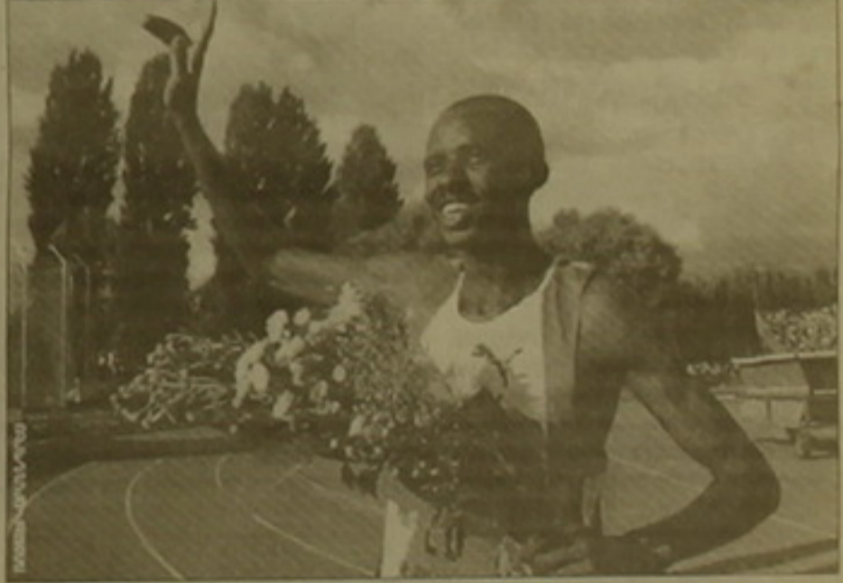
Ախարի երկուրդ տեղում մնաց

Ռոզալիա Կոլոնովա: «Ոսկե լիգայի» վերջին փուլում ախարի երկուրդ տեղում մնաց: Հազվադեպ անցկացվող 2000 մ վազ-լաստարությունում Չիան Ալ Գերուից (Մարոկկո) ցույց տվեց 4 րոպե 44,79 վայրկյան ժամանակ դրանով իսկ գերազանցելով ափսոսանքով հանդես եկող Նուրբիյին Մարսելիի նախկին նվաճումը: Այժմ Ալ Գերուիցն է մրցակցուհի: