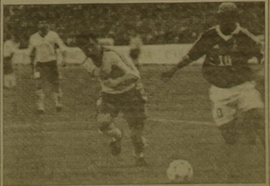
Ֆրանսիա-Հայաստան նախադասարանող հանդիպումից

Այսօր խոսք տոնի ակնառն կլինեն: Մայրաքաղաքի «Հրազդան» մարզադաժանում անցկացվելու է Հայաստան-Ֆրանսիա ֆուտբոլային հանդիպումը: Ուղիղ ժամը 21:00-ին բուլղարացի մրցավար Արման Ռուզունովը կազմարարի եվրոպայի առաջնության ընտրական 4-րդ խմբի հերթական խաղի սկիզբը: Բայց արդյո՞ք հերթական: Կարծում են, այս հանդիպումը դուրս է գալիս զուտ ֆուտբոլային խաղի ցրտանաչներից: Հիմնական ժամանակն այն է, որ Ֆրանսիայի հավաքականի կազմում հանդես են գալիս երկու հայրդիներ՝ Յուրի Զորկանից եւ Ալեն Պոդոլսկայը: Ընթերցողների ուշադրությանն են ներկայացնում Փարիզի մեր թղթակցի Արման Ազիզյանի հարցազրույցները օդանավում եւ երեսնում: