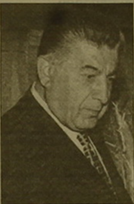
Կեն Գեմիրճյանը: Այնուհետև կողմնորոշվել է 9 անց 30-ին մեկնել են Բուրճաք, ԳՀԳ արտգործնախարար Յուրի Գեյդարովի հետ նախաստեղծ հանդիպմանը: Ժամը 14 անց 30-ից 17 անց 30 Բուրճաքի

Արդեն տեղեկացրել են, որ սեպտեմբերի 3-7-ը ՀՀ ԱԺ ժամանակաշրջանում, ի թիվս այլ ժամանակաշրջանների, մասնակցում էր Գեմիրճյանի Բուրճաքի եւ Բուրճաքի հոբելյանական միջոցառումներին: Սեպտեմբերի 6-ին Բուրճաքի «Մարիթիմ» հյուրանոցում, ուր իջեցանք էր հայկական ժամանակաշրջանը, առավոտյան 8 անց երեսույթի սահմաններում հանդիպում կայացավ ՀՀ ԱԺ նախագահ Կարեն Դեմիրճյանի եւ Ադրբեջանի խորհրդարանի նախագահ Ալեքեյ Բախալովի միջոցով: Վրաստանի խորհրդարանի նախագահ Ժվան Զեբադիան չէր մասնակցում, քանի որ վրաց ժամանակաշրջանում ընդհանրապես միջոցառումներին ներկա չէր առաջիկա ամիս կայանալի խորհրդարանական ընտրությունների ժամանակ: Ըստ տեղյակ աղբյուրների, խոսվել է դարաբաղյան հիմնահարցի խաղաղ կարգավորման մասին: Կառուցողական առաջարկներով հանդես է ե-