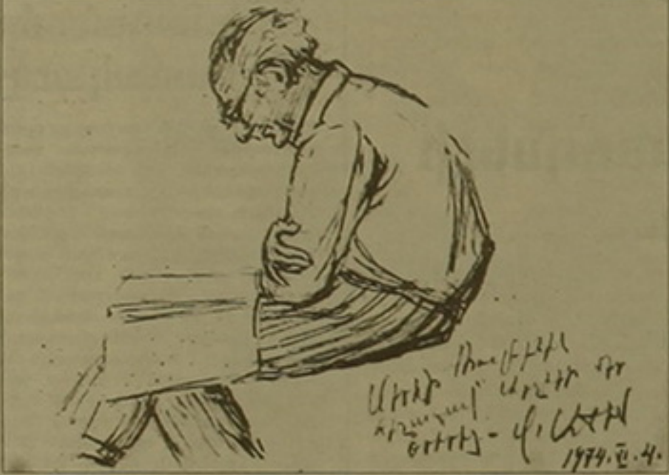
Ուրբեն Չարյանի գիծանկարը: Մասնակցաբար Վարդան Անճեյանի: Արգեթ, 1974 թ.

Սիւս. գեո նախանձ երկրորդ համաշխարհային պատերազմը «Ո՛վ է հայաստանը Արեւելան» հոդվածաւարը, «Վեր Հայաստան» վեպի խորհրդային առաջին հրատարակությունը իր առաջաբանով, «Արեւելանի կյանքը», իր դիտարկումները աշխարհայինը «Արեւելանի» «Լախաւալիդը» եւ նրա դասնությունը» վերնագրով: Դեռ դասանի՝ ես լավ իմեցի եւ այն խանդավառությունը, որ հասարակության մեջ առաջ բերեւ Չարյանի արվեստագիտական աշխատություններն ու գեղարվեստները: Ուրիշ էր արվեստագիտությունը մինչ այս բողոքը, ուրիշ էր հետ: Եւրոպական թվէ: Վրբան Փափաղյանի երկհասորչակի, Լար-Դոսի երկերի յոթ հասորի, Հովհաննէս Հովհաննիսյանի բանաստեղծությունների գրի հրատարակությունները, Սուրբուկյանի երկերի գիտական հրատարակության առաջին երեւի հասորի դասնական սեփական անձնական հնձայից աշխատանքները, Բակուրցի երկերի մի հասորչակի ընդարձակ առաջաբանը: Աղա նաեւ՝ «Սիրանույշ» մեծագրությունը եւ «Պետրոս Աղայանի նկարները եւ նրա ստեղծագործությունները»: Եւրոպական ժամանակակից գեղարվեստագիտության մեջ՝ «Էջեր հայկական ժամանակակից գեղարվեստագիտության» երկու հասորը, որի մեջ ամփոփված են հեղինակի նախապիտանքները եւ բաւ տարիների մտորումների արդյունքները: