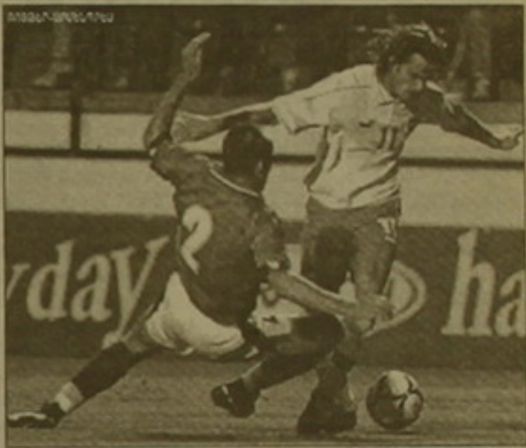
Պահ Չեխիա-Էվեյցարիա խաղից դիտումը, որը նվիրված էր ՀԱԷ-ի նախագահ Նելսոն Մանդելային, ավարտվեց մարտական ոչ-ոքիով՝ 2-2։

Ֆեմալիտի խաղ կայացավ Յոհանեսբուրգում։ Աֆրիկայի եւ «մնացած աշխարհի» հավաքականների հան-