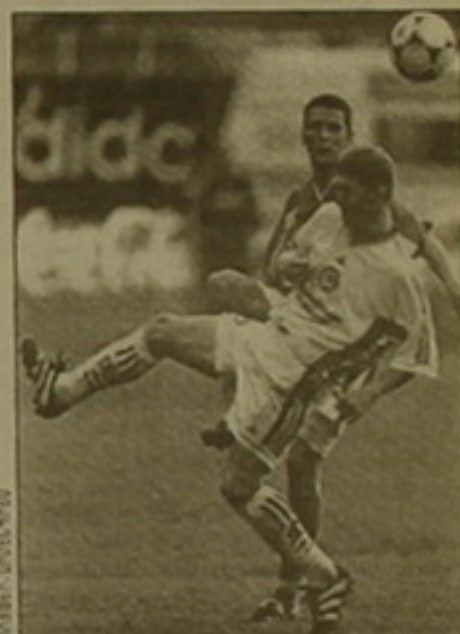
Հաջող տեղում են Գերմանիայի, ԱՄՆ-ի (3-ական միակոր) և Լոր Զեյլանդիայի (0) հավախակները:

Առաջ մրցեցին Բրազիլիայի և ԱՄՆ-ի հավախակները: Ձարմազված կազմով հանդես եկող աշխարհի ֆուտբոլի չեմպիոնները ԵՄՍ 1-0: Այս միակ օրը 13-րդ ռոմեին խմբից քաղաքացիների երիտասարդ հարձակող Ռոնալդինոն: Նեներ, որ ամերիկացիները լվարողացան իրացնել 11 մետրանոց տուգանային հարվածը: Երկրորդ տարից հետո միանձնյա առաջատարը Բրազիլիան է՝ 6 միակոր: