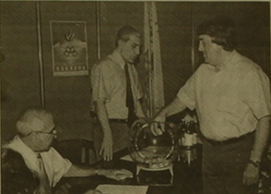
Անցկացվում է Ֆուտբոլի մրցաժամանակի վիճակահանությունը

Այնուհետեւ տեղի ունեցավ բասկետբոլի մրցումների վիճակահանությունը: Տղամարդկանց մրցաժամանակից ղեկավարողը թվով 20, թիմեր են ընդգրկվել, որոնք նույնպես բաժանվեցին 4 խմբերի: Անցյալում համահայտ բասկետբոլիս, ներկայումս