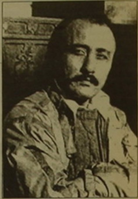
յուն գիր է:

վանդույթները բացառիկ ճաղանդով զարգացնող արվեստագետ է եւ, ինչպես նկատեց Տիկին Անիտան, «եթե մի հրաշքով Թորոս Ռոստոմովն ու Աւարգիս Պիծակը այստեղ լինեին, իրենց հիացնումը կհայտնեին», իսկ Նորայրը ոչ միայն իր ասելիքն ունեցող արժանագիր է, այլև հայանի դրամատուրգ, խոհուն գրականագետ, երբեմնի խմբագիր ու լրագրող, որին Եաս