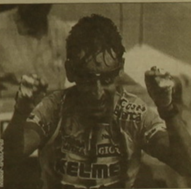
15-րդ ֆուլի հաղթող Ֆեանանգ Եկորիքեցը քաղող տկորսինը ես է մնում 6 րոպե 19 վայրկյանով, իսկ Ցուլլեն, որը երրորդն է՝ 7 րոպե 26 վայրկյանով:

«Տուր դը Ֆրանս» քաղծրյա հեծանվալալում անցկացվեց 15-րդ փուլը: Մեն Գոդեն-Էնգալի մրցասարածությունը առաջին ավարտեց խոսանացի Ֆեանանգը (46 մե): Երկրորդ տեղը գրավեց Եկորիքեցը, երրորդը՝ Ֆրանսիացի Ուիսար Վիրանկը: Մեծիկացի Լենս Արմաթոնգը, որն այս փուլում գրավեց յոթրորդ տեղը, արունակում է ընդհանուր հաշվարկում գլխավորել հեծանվալալը: «Յու Ես Պոսսալ» քիմի ներկայացուցիչը մյուս մասնակցներից քավականին առաջ է անցել: Երկրորդ տեղում ըն-