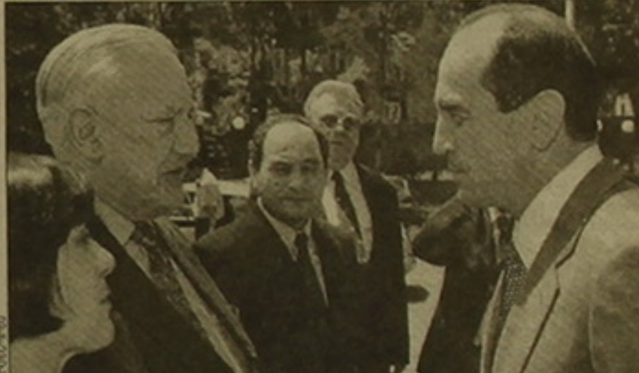
Քոչարյանի Պոնտիֆի զխաղաղությանը, հաղորդում է ՀՀ նախագահի մամուլ գրասենյակը:

Ստեփան Քոչարյանը նեց, որ Ֆրանսիան լինելով ԵԱՀԿ Միևակի խմբի համանախագահող երկրներից մեկը, կարելի էր արևելաստորային ուղի դարաբաղյան հակամարտության կարգավորման գործում: Ըստ նախա-