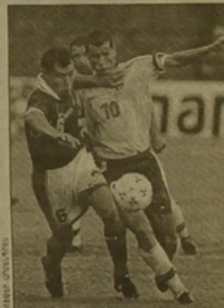
Տեղը 11 մետրանոցներ են։ Հիցեցնեն, որ խմբում Կոլումբիայի հետ խաղում նրանց հարձակող Մարին Պալերոն երեք անգամ վրիղեց 11 մ նշանակեցից։

Համառոտ դայաբուն անցան նաեւ կիրակի օրվա խաղերը։ Հասկաղես սուր էր անհաս ծրագրից երբ Բրազիլիայի եւ Արգենտինայի հավաքականների հանդիմանը։ Խաղի 11-րդ րոմբին արգենտինացիների դասաբաժանի Խաբալո Սորինը, որը միացել էր իր քիմակիցների գոլից, գնդակն ուղարկեց աշխարհի ֆուտբոլի լեմոնիների դարձաբաժան։ 22 րոմբ անց քաղաքացիների առաջատարներից մեկը Ռիվալդոն վարձուսրեծ իրացրեց տուգանային հարվածը։ Երկրորդ խաղակեսի սկզբում (48-րդ րոմբին) այսի ընկավ Ռոնալդոն։ Նա դիմուկ հարվածով հաշիվը դարձրեց 2-1 եւ 4 գոլով ստանձնեց առաջնության օմբարկուի դերը։ Խաղավարից 12 րոմբ առաջ Արգենտինայի հավաքականի ավագ Ռոբերտո Այալան ղեկ էր հավասարեցրել հաշիվը, բայց չկարողացավ իրացնել 11 մետրանոց տուգանային հարվածը։ Բրազիլացիների դարձաբաժանի Դիդակն օրաց գնդակը։ Ինչպես երեւում է, արգենտինացիների ամենացավոս