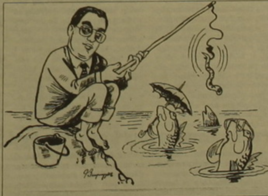
Տես էր 3

ՆԱՐԱՆ ԳՐԵԱՐԵՍԻՆ, ԵԿՈՆՈՄԻԿԱՅԻ ՆՈՐ ՆԱՅԱՐԱՐ ԱՐԾՆ ԴԱՐՔԻՆՅԱՆԸ, ՈՐԸ ՄԻՋԱԶԳԱՅԻՆ ԱՐԾՈՒՔԱՅԻՆ ՀԻՄՆԱԴՐԱՄԻ ՀԵՏ ԸՆՔԱԶՈՂ ԲԱՆԱԿԵՐՈՒՄՆԵՐԻ ԳՈՐԾՈՒՄ ՄԱՍՆԱԿԻԿԸ Է ԵՎ ՄԻՏԱՄԱՆԱԿ ԲԱՍԱՅԱՄԱՆԱՏՈՒՄ ՀԱՅԱՍՏԱՆՅԱՆ ՏՆՏԵՍՈՒՅԱՆ ՆԵՐԿԱ ԻՐԱՎԻՃԱԿԻ ՈՐԴԵՆ ՆԱՅԻԿԻՆ ՎԱՂԱՊԵՏ, ԿԱՌԱՎԱՐՈՒՅԱՆ ՈՒՂՎԱԾ ՄԱՏ-Ի ղաղաղներն այսդես արղարացի զնահասեց, իսկ այդ ղաղաղները, ինչդես երկ ենթաղել եւ «Ազգ», առնչվում են բյուջեի եկամտային եւ ծախսային մասերի կրծասում-համահարծեցմանը՝ սեղվեսուրին, որից այդդես խոսսալում է նոր կառավարությունը: Արծն Դարքինյանը բյուջեի դեֆիցիտի կրծկրես քիվ երկ լրագրողներին հրաժարվեց մասնակցել եւ սվեց բավական յուրօրինակ ծեռակերպում: «Գումար, որը նեղվեց վաղաղեղի կողմից մինչեւ 20 մլրդ դրամ»: Արծն Դարքինյանը, ըստ ամենայնի, չկամեցավ իրեն վերադրել բյուջեի ճեղվածի այս ղաղը, քե եւ դես է փաստել, որ 20-60 մլրդ դրամի ճեղվածը սեղծվել է հենց իր վաղաղությունն օրոք, իսկ վազգեն Սարգսյանը ժառանգել է այդ ճեղվածը՝ հաղաղաղելու ղազադադությունը: