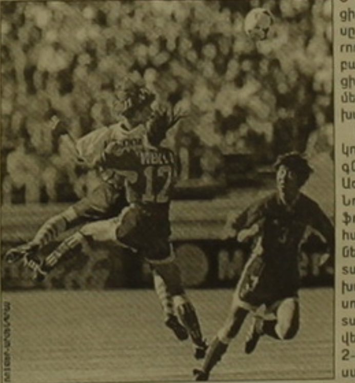
Խաղում են Չինաստանի եւ Ռուսաստանի հավաքականները

ԱՄՆ-ում անցկացվում է աշխարհի կանանց երրորդ առաջնությունը: Մասնակից 16 հավաքականները նախ իրենց հարթերությունները որոշեցին 4 օրվա ընթացքում: Այստեղ առաջին եւ երկրորդ տեղերը գրաված թիմերն իրավունք ստացան բարձրագույն լիգայի մրցույթի: Շաբաթը հանապազույց խաղերը: Պարսկաստանը մեկուկես ժամանակահատվածում հաղթեց Գերմանիային 3-2 հաշվով: Երկրորդ խաղում Գերմանիայի հավաքականին եւ հաջորդ փուլ մտան: Ընդ որում, առաջին խաղակեսից հետո ամերիկացիները գերում էին 1-2 հաշվով: Կիսաերգիկապիտան նրանց մրցակիցը կլինի Բրազիլիայի հավաքականը: Վերջինիս եւ Լիգերիայի ընտրանու խաղը մի փոքր տարօրինակ ընթացավ: Պեյլեի եւ Ռոնալդոյի հայրենակիցները առաջին խաղակեսում