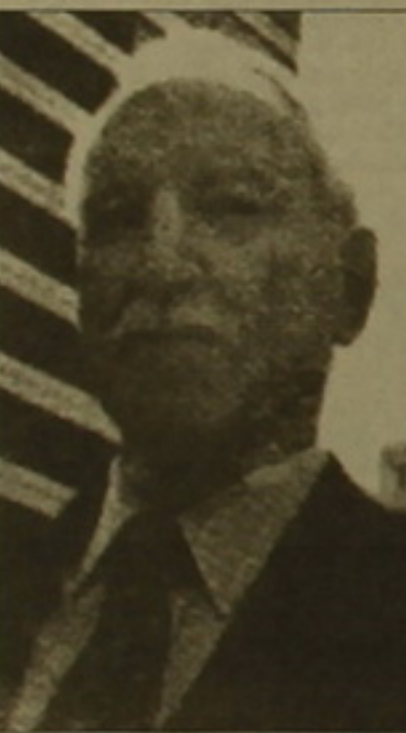
Ինչ կարող է այդ արգելից հարթահարել տասնամյակային Կոնգրեսի արձակուրդային տարադրումները:

Հունիսի կեսերին նախագահ Բիլ Բլինթոնն օգտագործեց սահմանադրական իր բացառիկ իրավունքներից մեկը՝ Լյուսեմբուրգում դեպոզիտ նշանակելով երկրի առաջին բացառապես «կապույտակ» դիվանագետին Ջեյմս Հոունին: Կոնգրեսը 1997 թ. ից ի վեր արգելադրում էր վերջինիս նշանակումը, հասկալիս Վանադիան կուսակցության ղեկավարողական թեմն ադրբեջանցի էր համարում դեպոզիտի տրամադրումը հայերի հոմոսեքսուալի նշանակումը: Նախագահին այս անգամ օգտագործեց Կոնգրեսի արձակուրդը եւ Հոունին նշանակեց դեպոզիտ Լյուսեմբուրգում, ինչն ամերիկյան մամուլի կողմից գնահատվեց իբրև «արձակուրդային նշանակում»: Հիշեցնենք, որ Մ. Նահանգներից նախագահի առաջադրած դեպոզիտային թեմնադրումները մեծ է Կոնգրեսի համադասարան հանձնաժողովի «հարգանքներ» անցնել դեպոզիտ նշանակվելու համար: Անհրաժեշտության դեպքում նախագահը կարող է այդ արգելից հարթահարել տասնամյակային Կոնգրեսի արձակուրդային տարադրումները: