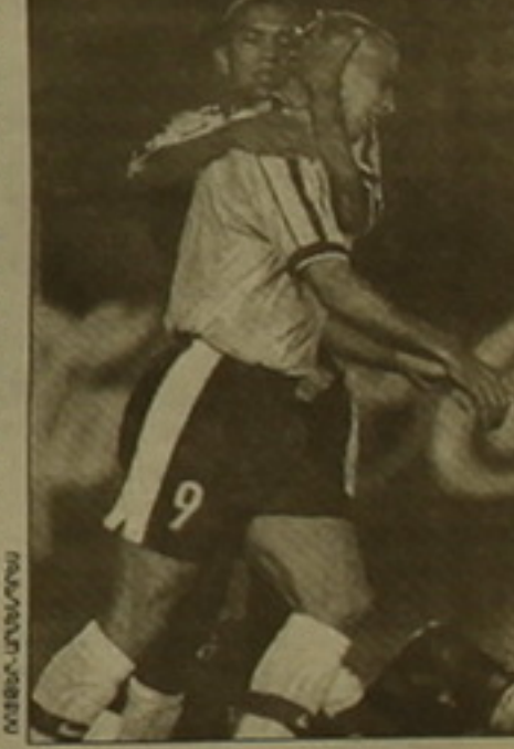
Չեմոխոնի մրցակցի դարձաբարձր: Լարված ընթացքով այս խմբի մյուս խաղը: Մեխիկոյից 1-0 հաշվով հաղթեցին Չիլիի հավաքականին: Հարավային Ամերիկայի չեմպիոնը կորոզվի հուլիսի 18-ին:

Պարզվալյում մեկնարկել է Ամերիկայի գավաթի 39-րդ խաղարկությունը: Չնայած ճնշական սուր ճգնաժամին, հարավամերիկյան այս երկիրը դասաբարձրություն է ընդունել մրցումների մասնակիցներին: Կաստարովը է մեկ նոր մարզադաս, երեք հիմնովին վերանորոգվել են: Խաղարկությանը մասնակցում են աշխարհամասի 11 երկրների հավաքականներ, ինչպես նաև հրավիրված ճաղոնիայի ընտրանի: Թիմերը բաժանված են երեք խմբերի, որոնցից յուրաքանչյուրում չորս թիմ է ընդգրկված: Հաջորդ փուլ դուրս կգան ութ լավագույն հավաքականները: Մի խմբերի կազմերը, առաջին խումբ՝ Բոլիվիա, Պարագվայ, Պերու, ճաղոնիա, երկրորդ խումբ՝ Բրազիլիա, Վենեսուելա, Մեխիկո, Չիլի, երրորդ խումբ՝ Արգենտինա, Կոլումբիա, Ուրուգվայ, Էկվադոր: Երկու խմբերում կայացել են առաջին հանդիպումները: Առաջին խմբում Պերուի հավաքականը համառոտաբար կարողացավ 3-2 հաշվով հաղթել ճաղոնիայի թիմին: Դասի տերերը դարձան իրենց շքանշանը, չնայած 40 հազար ֆուտբոլիստների աջակցությանը, չկարողացան առավելության հասնել բոլիվիացիների նկատմամբ՝ 0-0: Երկրորդ խմբում աշխարհի ֆուտբոլի չեմպիոն Բրազիլիացիները 7-0 ջախջախիչ հաշվով դասաբարձրության մասնեցին Վենեսուելայի հավաքականին: Իր խաղով փայլեց Ռոնալդոն, որը 2 գն-