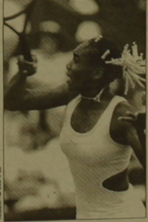
Վեոնու Ուլիմպիկոն 1/8 եզրափակիչում Ուսթունյանից դասաբարձրում կրած (3-6, 2-6, 3-6) Բորիս

Ուլիմպիկոնի մրցաբարձրում որոշվեցին Եվրոպայի եզրափակիչ փուլի բոլոր մասնակիցները: Տղամարդկանց մրցումներում անավարտ խաղերը Եվրոպայի Թիմ Հենմանը (Անգլիա) հաղթեց Ֆիմ Կուրյեին (ԱՄՆ), Սեդրիկ Պյոլինը (Ֆրանսիա) Կարել Կուչերային (Սլովակիա): Այժմ Եվրոպայի եզրափակիչում Հենմանն ու Պյոլինը կմրցեն իրար հետ: Այդ փուլի մյուս զույգերը կազմել են Անդրե Ադասին (ԱՄՆ) և Գուստավո Կուերտենը (Բրազիլիա), Պասրիկ Ուսթունյանը (Ավստրալիա) և Թոդ Մարտինը (ԱՄՆ), Մարկ Ֆիլիպուսիսը (Ավստրալիա) և Փիթ Մամփրասը (ԱՄՆ): Մասնագետները նույն են աշխարհի թիվ մեկ թենիսիստ Մամփրասի հետ հաղթանակը կանադացի Դանիել Նեստորի նկատմամբ: Բայց և ավելացնում են, որ նրան դժվարին մենամարտ է ստանալու Եվրոպայի եզրափակիչում, քան որ Ֆիլիպուսիսը Եվրոպայում է հանդես գալիս: Մարզաբարձրները հոսնկայս ծափահարություններով ճանապարհեցին