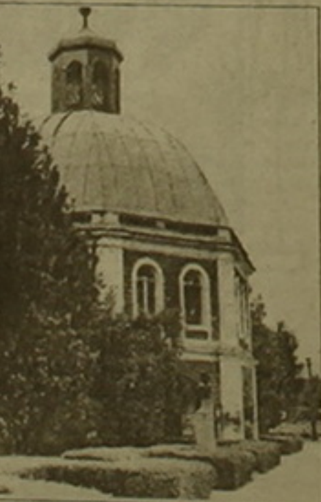
Գյան ճեմարանի նորոզված Ենի հանձնումը հոգեւոր կրթողալի տաներին: 125-ամյա ճեմարանի վերաբացվեց բարեարներ տեր և կն Հուկնանյանների միջոցներով, իսկ Երբարական աբխասանները ՀՕՖ-ի հսկողությամբ իրականացրեց «Ջրաբեր» ընկերությունը: Վերանորոզվեցին նաեւ Գյուլուրի Վազգեն Ա կաթողիկոսի անվան դղորցը, Նոր Այնբաղի «Արամ և Հասմիկ Կարամանուկյան» դղորցը ամերիկաբնակ Կարամանուկյան ընտանիքի աղակցությամբ: Բացվեցին Եւս ամաղային ճամբարներ, որոնցից արժանահիշատակ է Վայոց ձորի Հերոն գյուղի մոտ գտնվող «Միտրույե» ճամբարը ամերիկահայ բարեարուկի Անու Կարեւոյանի հովանավորությամբ: Նրա օժանդակությամբ է սեղծվել մաեւ «Մաթեոյան կրթավար» ծրագիրը, որի համաղայն հայաստանաբնակ սաղ ուսանողների ուսման վարձը վճարում է Հայ օգնության ֆոնդը կրկին Անու Կարեւոյանի աղակցությամբ: Մա հնարավորություն է սաղ ուսանողների Եւս կառուցակելու հնգամյա ու

գյան ճեմարանի նորոզված Ենի հանձնումը հոգեւոր կրթողալի տաներին: 125-ամյա ճեմարանի վերաբացվեց բարեարներ տեր և կն Հուկնանյանների միջոցներով, իսկ Երբարական աբխասանները ՀՕՖ-ի հսկողությամբ իրականացրեց «Ջրաբեր» ընկերությունը: Վերանորոզվեցին նաեւ Գյուլուրի Վազգեն Ա կաթողիկոսի անվան դղորցը, Նոր Այնբաղի «Արամ և Հասմիկ Կարամանուկյան» դղորցը ամերիկաբնակ Կարամանուկյան ընտանիքի աղակցությամբ: Բացվեցին Եւս ամաղային ճամբարներ, որոնցից արժանահիշատակ է Վայոց ձորի Հերոն գյուղի մոտ գտնվող «Միտրույե» ճամբարը ամերիկահայ բարեարուկի Անու Կարեւոյանի հովանավորությամբ: Նրա օժանդակությամբ է սեղծվել մաեւ «Մաթեոյան կրթավար» ծրագիրը, որի համաղայն հայաստանաբնակ սաղ ուսանողների ուսման վարձը վճարում է Հայ օգնության ֆոնդը կրկին Անու Կարեւոյանի աղակցությամբ: Մա հնարավորություն է սաղ ուսանողների Եւս կառուցակելու հնգամյա ու