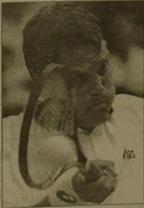
Թոմաս Էնկվիստ 6-7, 6-2, 0-6, 8-6 հաշվով դառնություն մասնեց սլովակ Կարոլ Կուլոյզերը:

Տղամարդկանց մրցաշարում շարունակում է իր հաղթարշավը Էվոլ Թոմաս Էնկվիստը: Այս անգամ նա «զոհը» դարձավ Էվոլյարացի Մարկ Ռոսսին: Էնկվիստը մրցակցին դառնություն մասնեց 6-3, 6-4, 6-4 հաշվով եւ կիսաեզրափակիչում կմրցի էվոլյարացի Նիկոլաս Լադենցիի հետ: Շատերը համարում են, որ Մեյրուտեի խաղադաշտում այս երիտասարդ թենիսիստի բախտը դադարի է հասել: Բայց մի քիմ «բախտը» թերեւո՞ւմ կարելի է «Մեծ սաղավարտի» մրցաշարի կիսաեզրափակիչ մտնել: Ասենք, որ վերջին խաղում Լադենցին համառ դալարում (7-6,