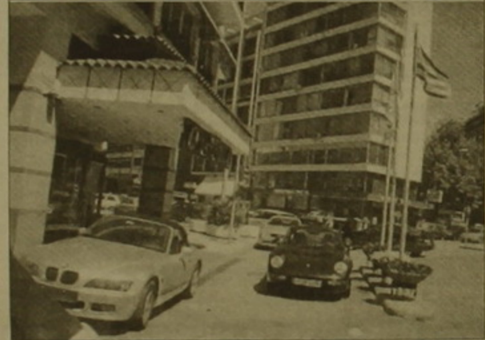
Մալոնիկցիները ի արթնություն երեւոցների մեծաւուր «Մերտեղեւերի» եւ «Ջիդերի» փոխարեն գերադասում են փոփոխ «Պեժներ», «Օփելներ» եւ այլն: Պատճառը թեւեւ սեղացիների համեստ ապրելակերպն ու նեղ փողոցներն են:

Քաղաքի փողոցներում երբեք չեն յուրաքանչյուր 10 փոխադրամիջոցից երեք մոտոցիկլներ են Քաղաքի նեղ փողոցները հիշեցնում են մոտոցիկլի որտեղ մրցման են դուրս եկել կին ու տղամարդ, ահել ու ջահել: Մոտոցիկլների այս խիստ կանգառները երբեք անհանգստացնում են դարձնում մայրերն ու փողոցները: