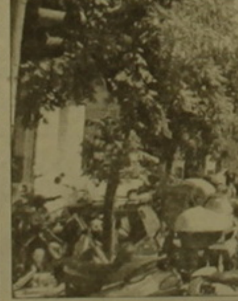
Այստեղ եւս կարելի է հաճախ հանդիպել առօրյա փողոցի մեքենաների, սակայն ի արթնություն երեւոցի այստեղ փողոցները անմիջապես վերանորոգվում է: