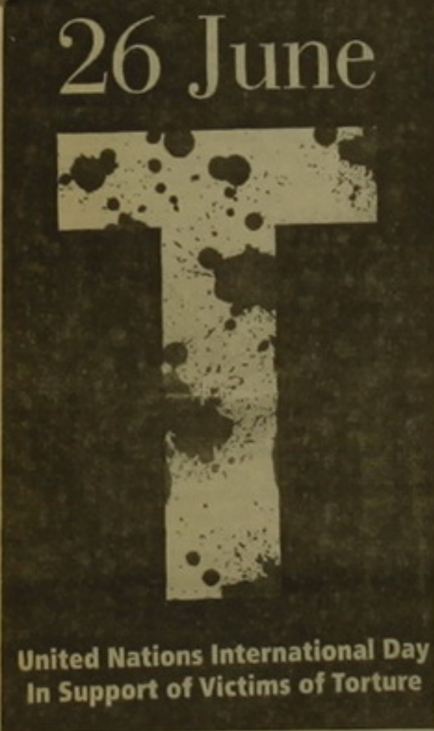
United Nations International Day In Support of Victims of Torture

ման և անօրինական առևտրի դեմ միջազգային օր» մասնակցել։ Իսկ արդ 2007-ին ՄԱԿ-ի ընտանական և սոցիալական խորհրդի նախաձեռնությամբ որոշվել է այդ օրը միաժամանակ նշել նաև որդես «Կոկաինի դեմ միջազգային օր»։