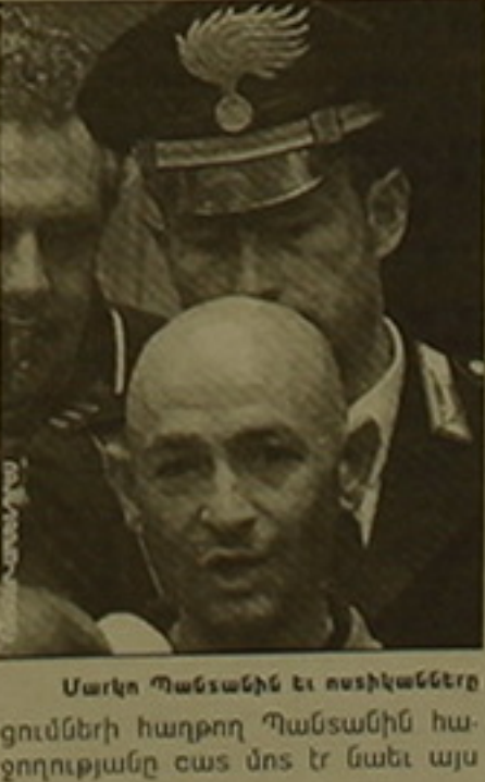
Մարկո Պանսանիի եւ ոտսիկանները ցույցների հաղթող Պանսանիի հաջողությանը օտո մոտ էր նաև այս անգամ:

Ավարտվեց հեծանվային սպորտի ամենահեղինակավոր բազմօրյա վազելից մեկը՝ «Ջիրո դ'Իտալիան», որն այս տարի անցկացվում էր 82-րդ անգամ: Հեծանվավազի ավարտվեց խայտառակությամբ: Արդյունքների ավարտից երկու փուլ առաջ 20-րդ տուրից հետո անցկացված մարզիկների աշխատանքները ցույց սվեցին, որ հեծանվավազի առաջատար Մարկո Պանսանիի եւ եւս մեկ աստիակ այլ հեծանվորդների աշխատանքները մասնակցությունը ավելի է սովորականից: Մարզիկներն արգելված խթանիչներ օգտագործելու համար որակագրկվեցին: Շասերի հիտոլոլոլային մեջ դեռ բարձր են անցյալ տարվա «Տուր դը Ֆրանս» հեծանվավազի հետ կապված դոմինանտային խայտառակությունները: Եվ ահա նոր սկանդալ: Անցյալ տարվա նմանօրինակ մրցումների հաղթող Պանսանիի հաջողությանը օտո մոտ էր նաև այս անգամ: «Մերկասոն Ունո» քիմիա առաջատարը հաղթեց չորս լեոնային փուլերում եւ վստահորեն զիջավորում էր հեծանվավազը: Բոլորը համոզված էին, որ մինչեւ վերջ նա ոչ մեկին չի զիջի առաջատարի վարչազույն մարզաբարձից: Մական ամեն ինչ այլ կերպ ստացվեց: Այժմ Պանսանիին ընկճված է ու հայտարարում է, թե մտածում է մարզական կարիերան ավարտելու մասին: Մարգուսի մարզիկ հույս ունեն, որ չի հեռանա սիրելի «Շովահներ» (Պանսանիին այսօր են կոչում սափրած զուլիսը զիջաբարձի կաղելու համար): «Ջիրո դ'Իտալիայի» հաղթող դարձան Պանսանիի համերկացիները: Չեմոլիոնի կոչումը նվաճեց Իվան Գոսսին («Պոլոնի»): Երկրորդ եւ երրորդ մրցանակակիցներ դարձան Պաուլո Սավոլոնիին («Սայելո») եւ Ջիլբերտո Սիմոնին («Բալլան»):