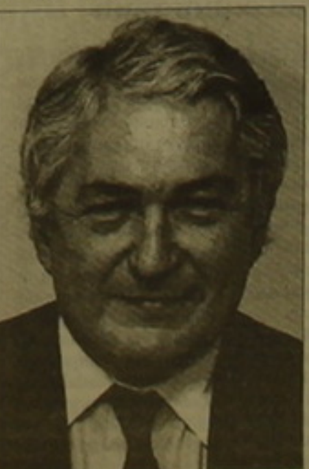
Մոխսակ՝ այցելելու բանկի վերակա- ռուցման գործընկեր եւ հանրային այգին: Այնուհետեւ նա ուղղաթիռով կմեկնի

Այսօր երեկոյան, երբ 33 հասարակա- յությունը նոր-նոր կսկսի «մարտի» ԱՅՑ ընտրությունների արդյունքները, Ե- րեւան կժամանի Համախառնապես բանկի (ՀԲ) նախագահ Ջեյմս Վուլ- ֆենստերը՝ շվեդից հետ: Ինչպե՞ս ար- դեն սեղեկացրել էր «Ազգը», ՀԲ նա- խագահը այցելելով Չայաստան, իսկ դրանից առաջ Ադրբեջան եւ Վրաս- տան, նույնպես ունի ուղղակիորեն անձնադրանք Ժամանակակից սար- ժապատում սիրող իրավիճակին եւ բանկի կողմից իրականացվող ծրագ- րերին: Հայաստանում նա կհանդիպի կառավարության ղեկավարներին, խաղաղացիների ներկայացուցիչնե- րին, կրոնական, ինչպես նաեւ գոր- ծարար Երջանակների վերահսկալի: Պրեն Վուլֆենստերը 33 նախագահ Ռո- բերտ Զոյարյանի հասուկ հյուրն է լի- նելու եւ նրա հետ թափանցական բա- նակցություններ է վարելու ընթացիկ սենսական իրադարձությունների եւ Հայաստանի առաջագ սենսական զարգացման վերաբերյալ ՀԲ նախա- գահը կհանդիպի նաեւ Ե. Ս. Օ. Տ. Տ. Գաթաբի Առաջինի հետ Երջանու- մում: Վաղը ՀԲ նախագահը կենկնի