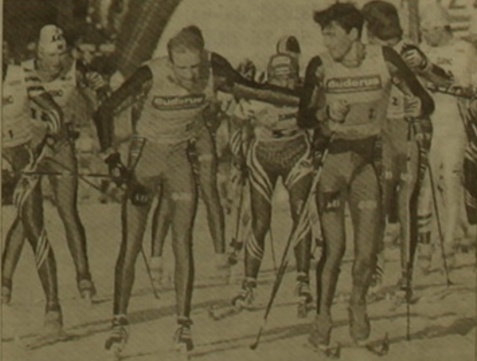
Չեխիայի Նուր Աստոն Բաղաբում անցկացվեց դահուկավազի աշխարհի գավաթի խաղարկության երեքական փուլը: Տղամարդկանց 4x10 կմ փոխապես մրցակարգում հաղթեց Ավստրիայի հավաքականը: Երկրորդ եւ երրորդ տեղերը գրավեցին Իտալիայի եւ Նորվեգիայի ֆառայիկները: